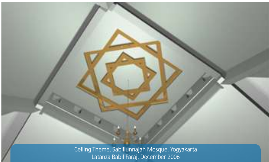
Ceiling Theme, Sabilunnajah Mosque, Yogyakarta Latanza Babil Faraj, December 2006