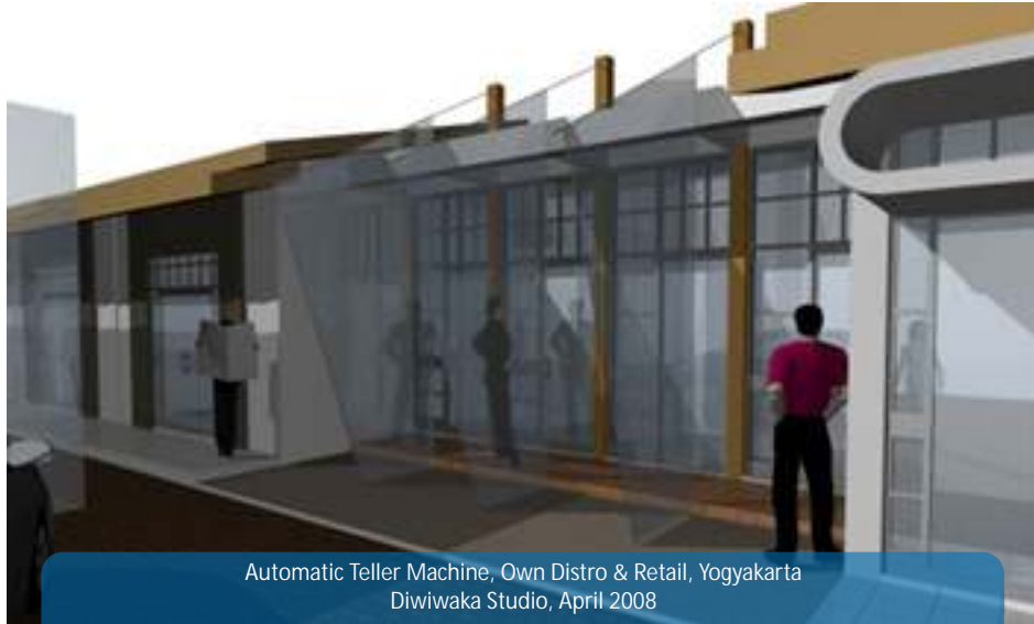
Automatic Teller Machine, Own Distro & Retail, Yogyakarta Diwiwaka Studio, April 2008