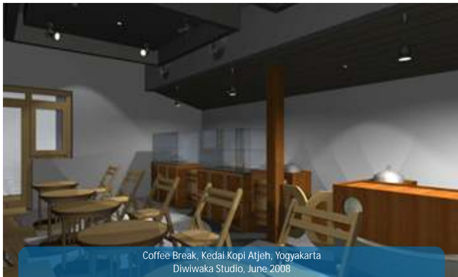
Coffee Break, Kedai Kopi Atjeh, Yogyakarta Diwiwaka Studio, June 2008