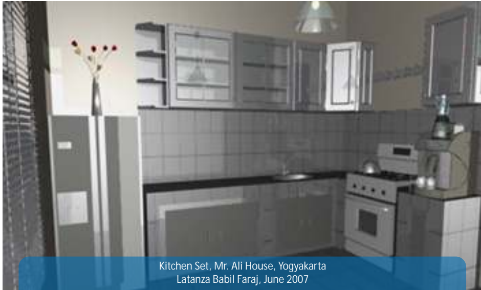
Kitchen Set, Mr. Ali House, Yogyakarta Latanza Babil Faraj, June 2007