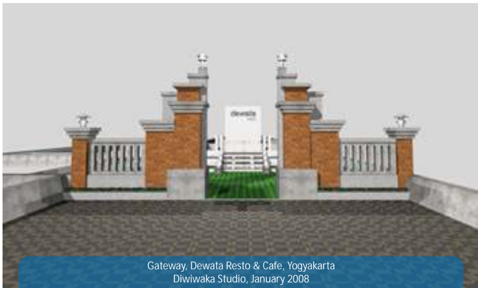
Gateway, Dewata Resto & Cafe, Yogyakarta Diwiwaka Studio, January 2008