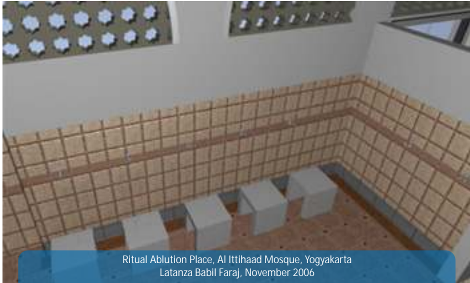
Ritual Ablution Place, Al Ittihaad Mosque, Yogyakarta Latanza Babil Faraj, November 2006