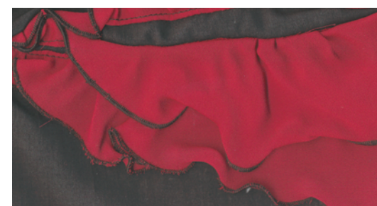
Jupe a godets avec empiecement a volants

Longueur au dessous de jenoux Taille normale Ceinture droite Empiecement demicercle sur le cote droit, avec volants en mousseline superposés Poche soufflée surpiquée coté gauche. Fermeture a glissiere invisible dans la couture sur le cote gauche