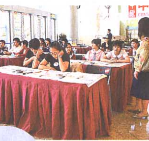
■剛於上星期舉行的「現代水墨畫創作工作坊」，反應非常熱烈，參加者當中更有不少年輕人及學生。