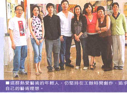
■這群熱愛藝術的年輕人，仍堅持在工餘時間創作，追求自己的藝術理想。