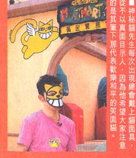
■神秘貓先生每次出現總會戴上貓面具，從不以真面目示人，因為他希望大眾注意的，是其中代表歡樂與和平的笑面貓。

本年5月，信和集團便贊助了神秘貓先生香港之旅，並邀請牠到香港黃金海岸繪畫代表歡樂與和平的黃色笑面貓。除此之外，貓先生更在5月20日及21日教60位小朋友繪畫黃色小貓咪，將和平歡樂的信息帶給香港人。部分小朋友創作的小貓咪，更已跟隨神秘貓先生到世界各地巡迴展覽，非常有意義。