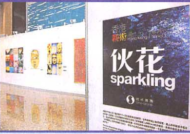
■本年4月於奧海城一期舉行的「伙花」藝術展，為「香港·藝術」揭開序幕。

展示資深藝術家傅世亨的篆刻、書法及水墨畫，還安排了四節由傅氏教授的水墨畫及書法工作坊，讓大眾有機會嘗試創作國畫及臨摹。