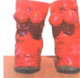
■早前舉行的「山寨作業」展，展出中大藝術系學生的作品，這個名為「keep up」的雕塑，盡顯學生的創意。