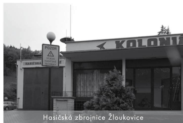
Hasičská zbrojnice Žloutovice