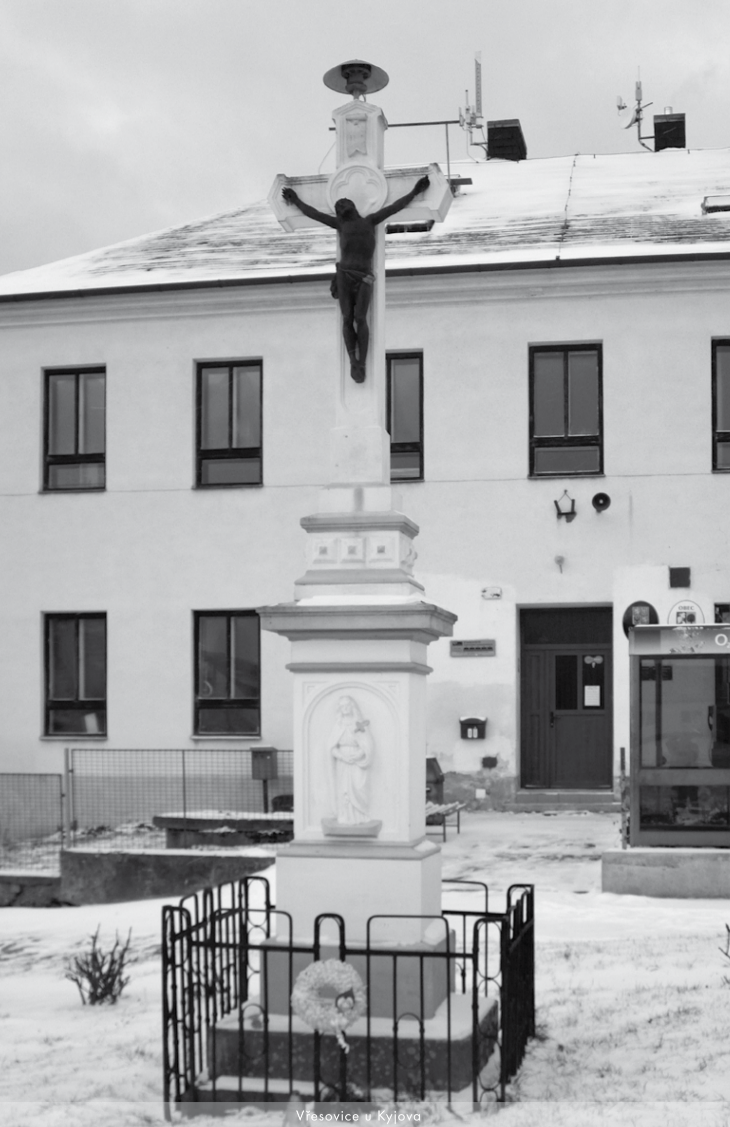
Vřesovice u Kyjova