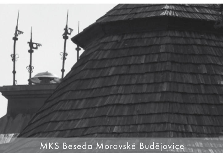
MKS Beseda Moravské Budějovice