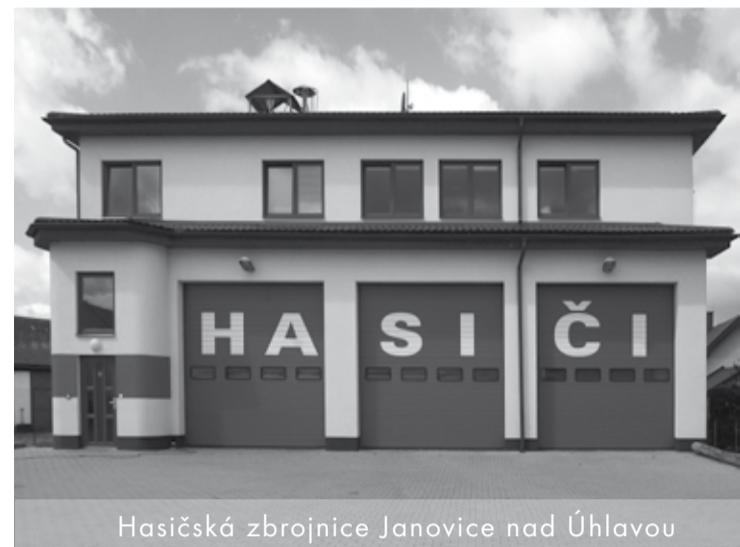
Hasičská zbrojnice Janovice nad Úhlavou