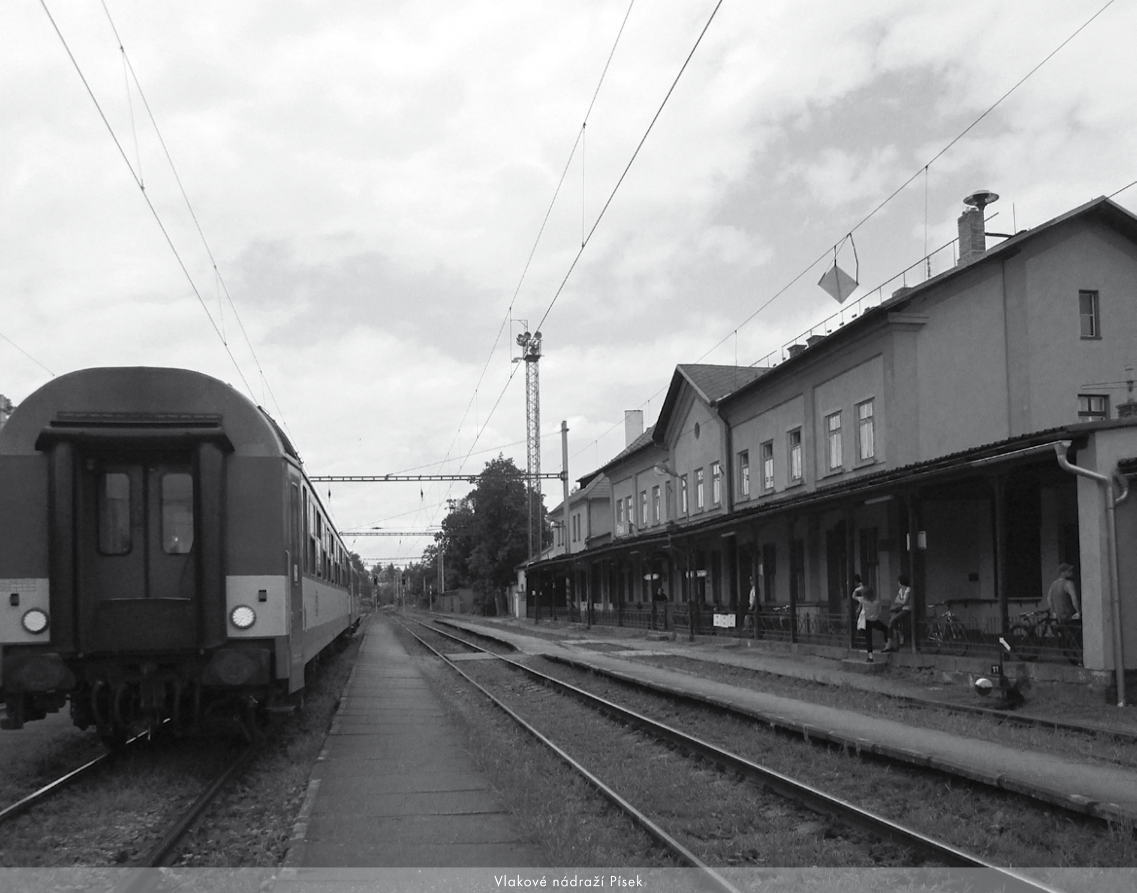
Vlakové nádraží Písek