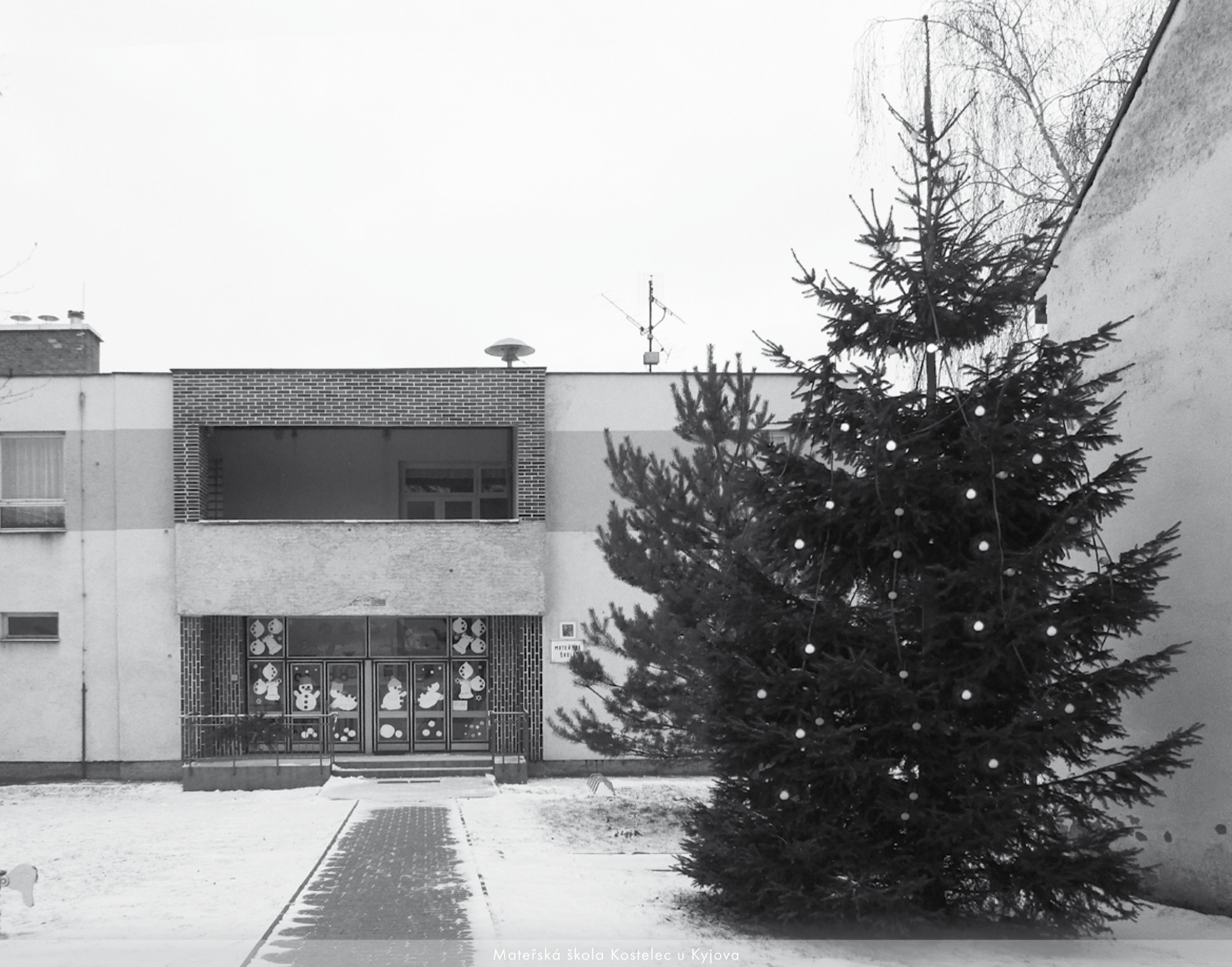
Mateřská škola Kostelec u Kyjova