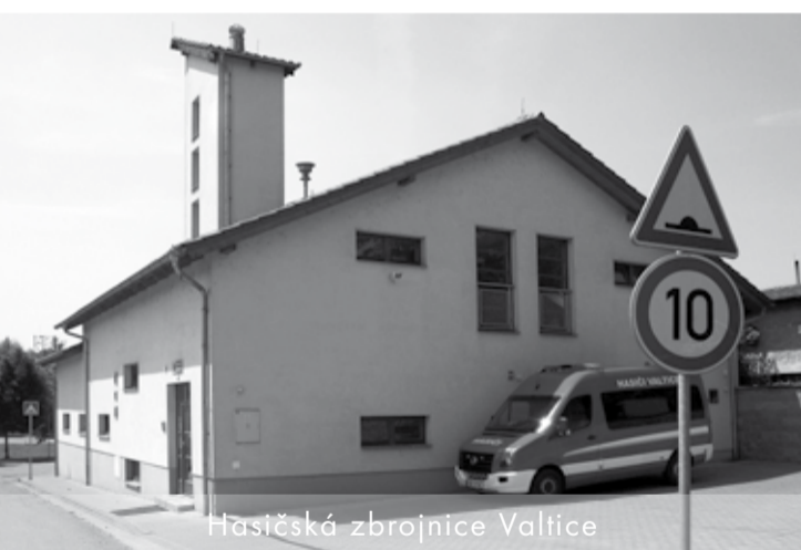
Hasičská zbrojnice Valtice