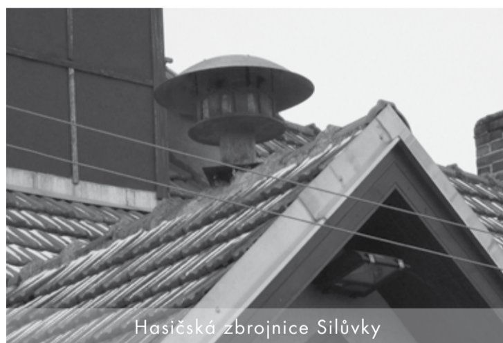
Hasičská zbrojnice Silůvky