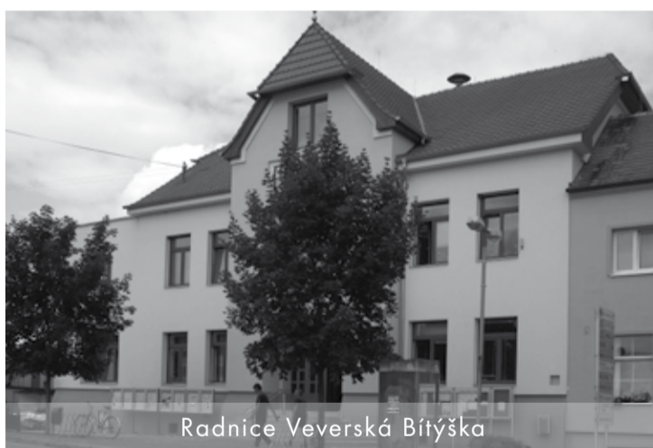
Radnice Veverská Bítýška