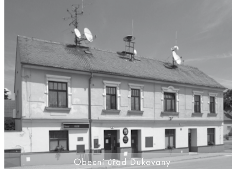
Obecní úřad Dukovany