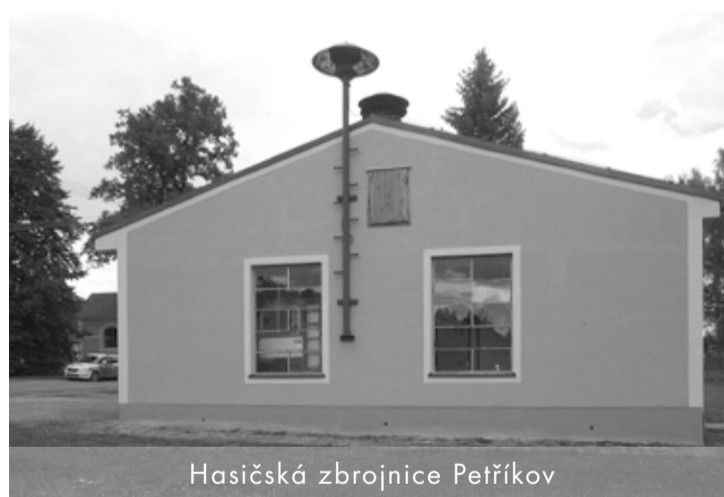
Hasičská zbrojnice Petřikov