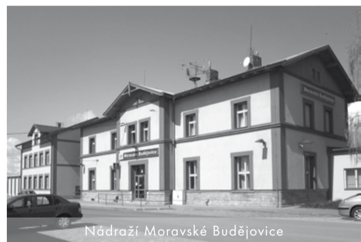
Nádraží Moravské Budějovice