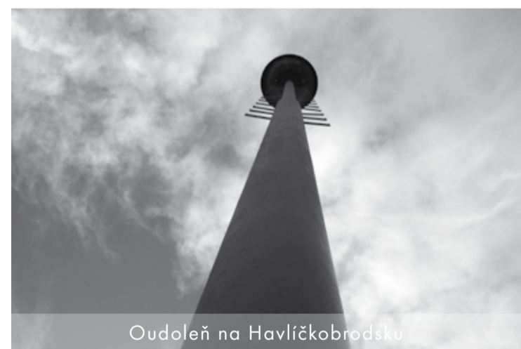
Oudoleň na Havlíčkovobrodsku