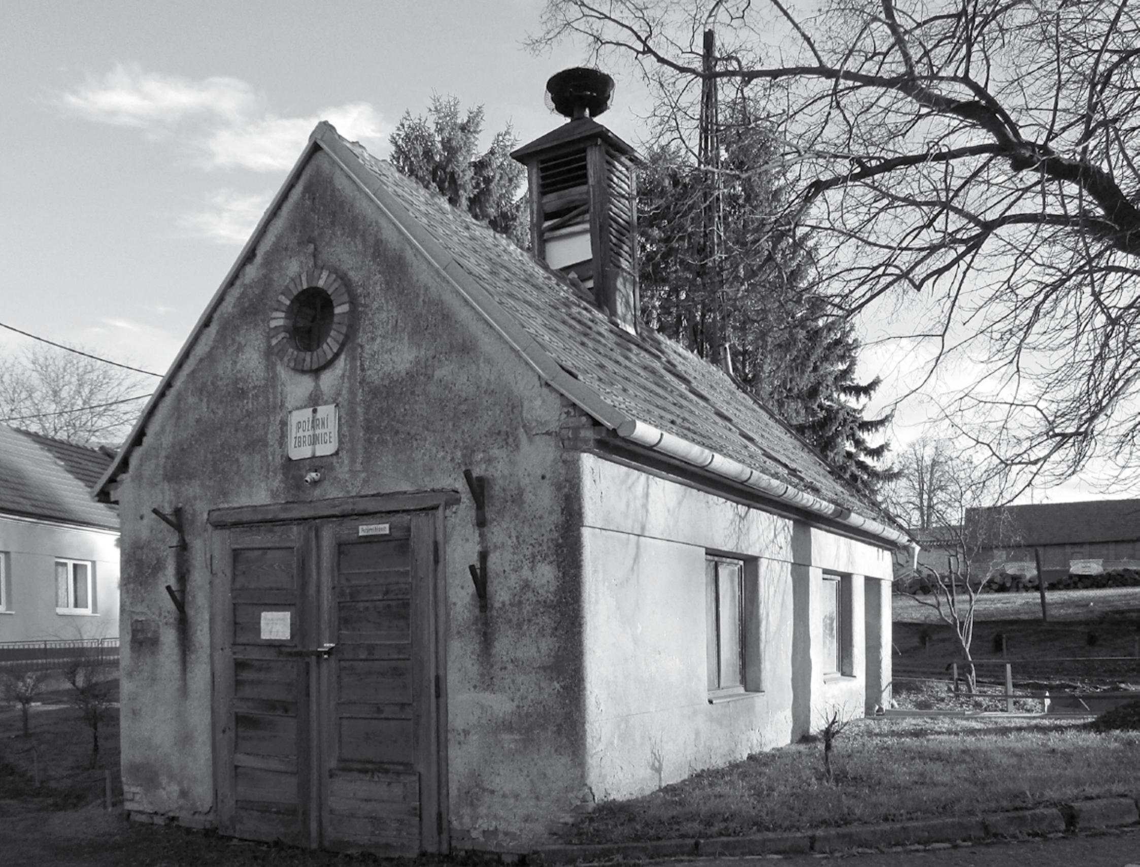
Hasičská zbrojnice Bohumilice