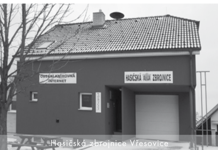
Hasičská zbrojnice Vřesovice