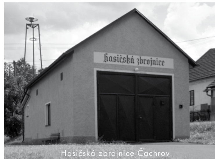
Hasičská zbrojnice Čachrov