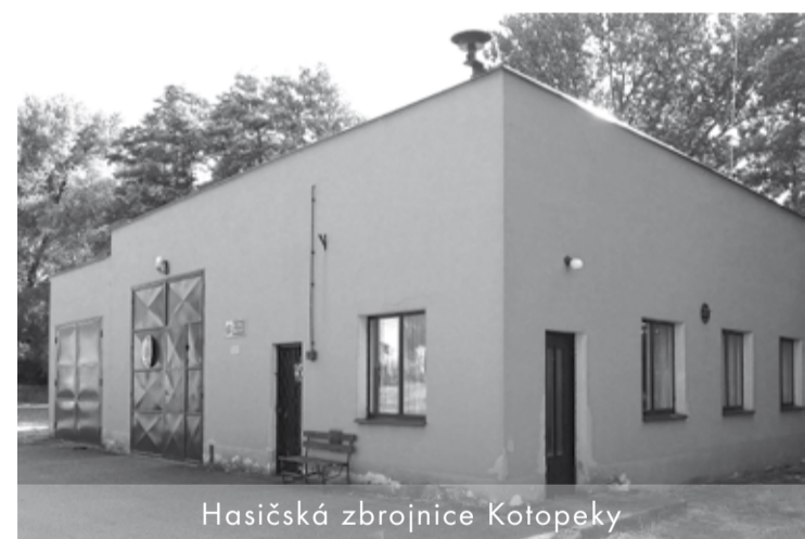
Hasičská zbrojnice Kotopeky