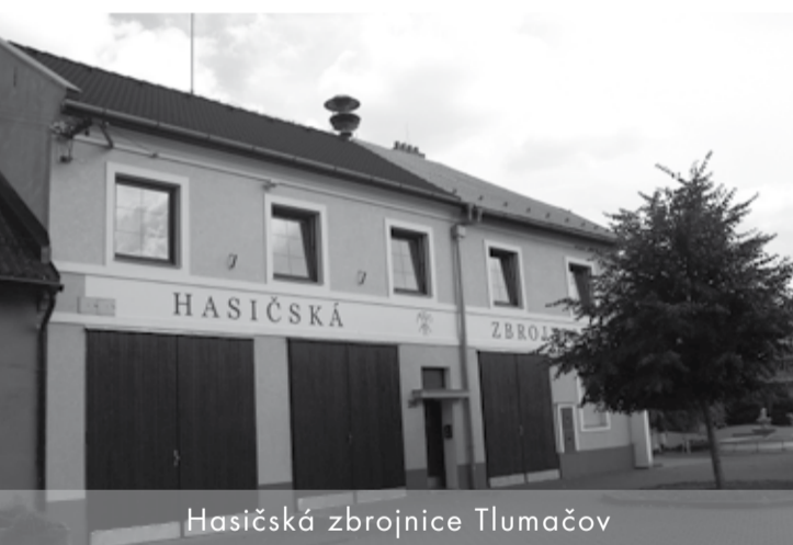
Hasičská zbrojnice Tlumačov