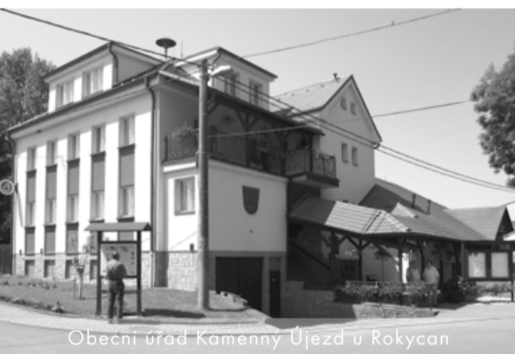
Obecní úřad Kamenny Újezd u Rokycan