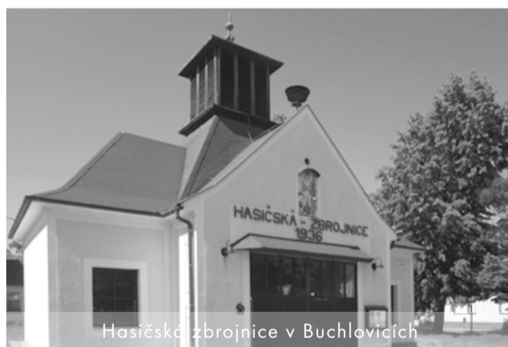
Hasičská zbrojnice v Buchlovicích