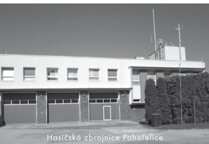
Hasičská zbrojnice Pohořelice