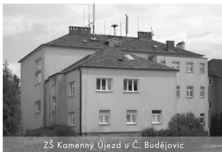
ZŠ Kamenný Újezd u Č. Budějovic