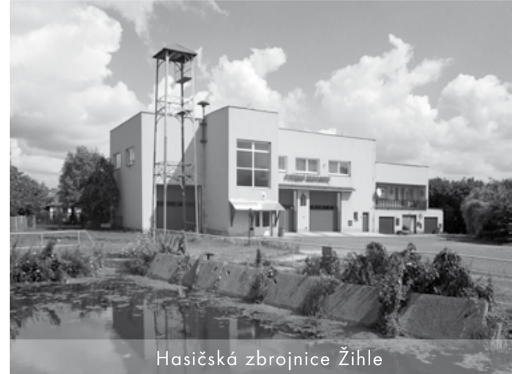
Hasičská zbrojnice Žihle