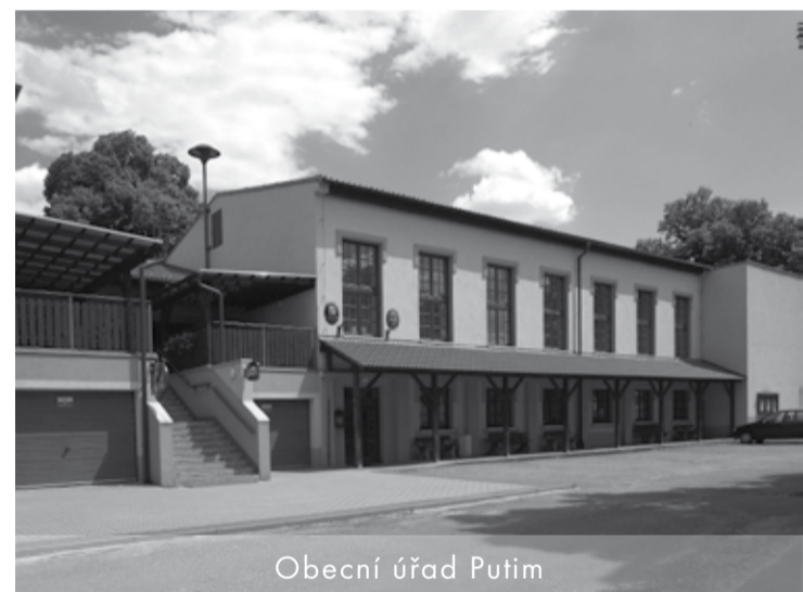
Obecní úřad Putim