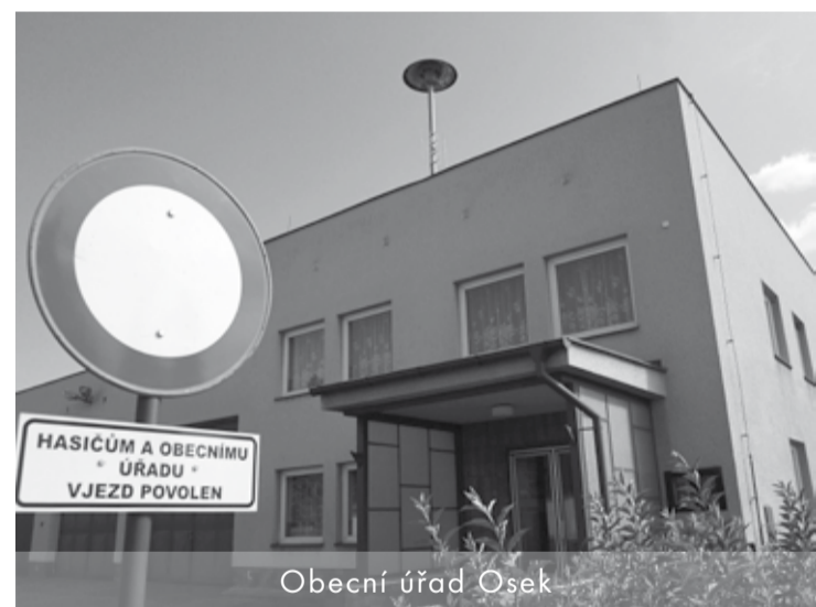
Obecní úřad Osek