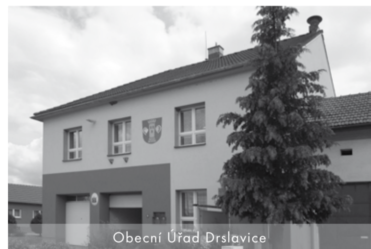
Obecní Úřad Drslavice