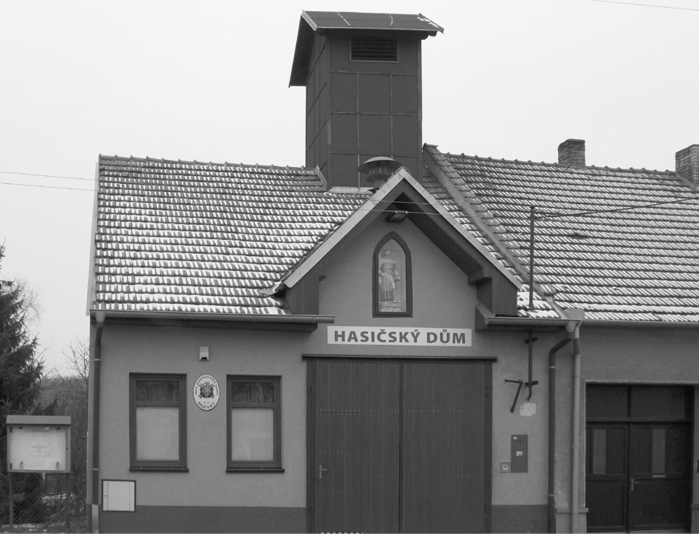
Hasičská zbrojnice Silůvky