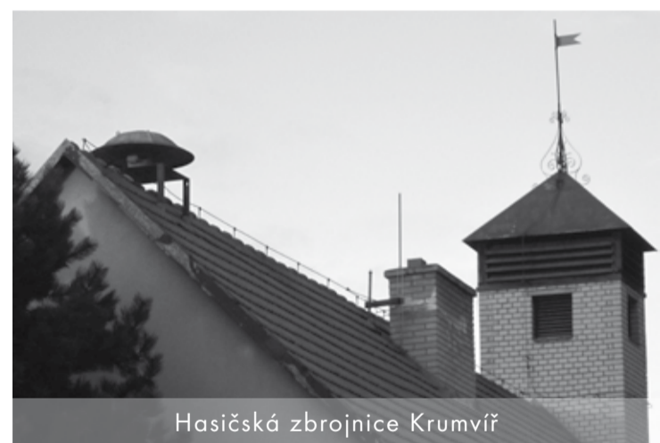
Hasičská zbrojnice Krumvíř