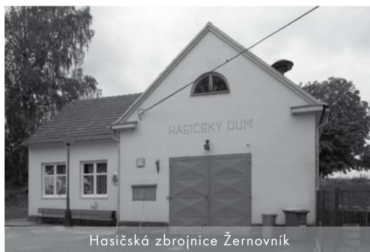
Hasičská zbrojnice Žernovník