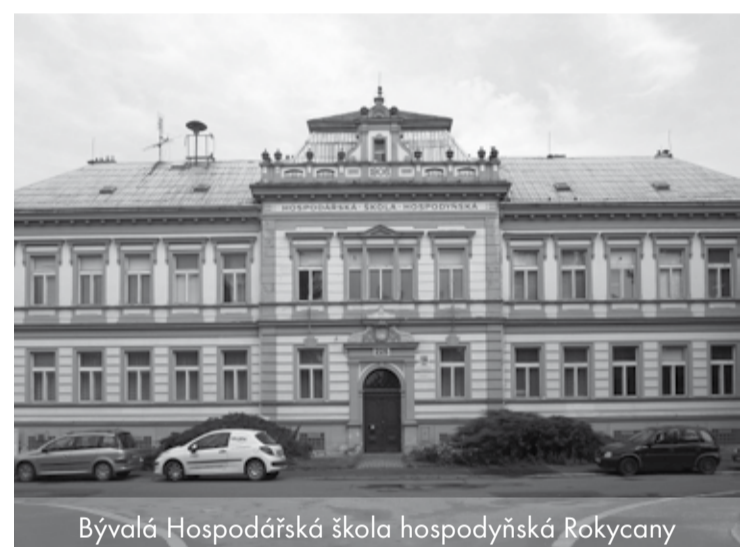
Bývalá Hospodářská škola hospodyňská Rokycany