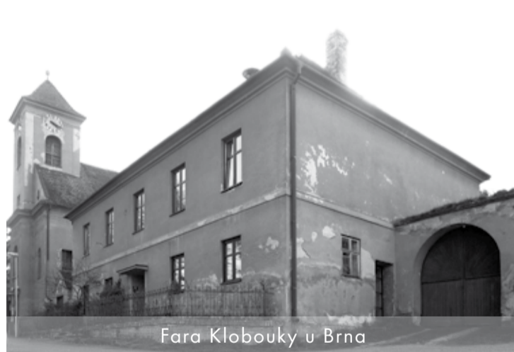
Fara Klobouky u Brna