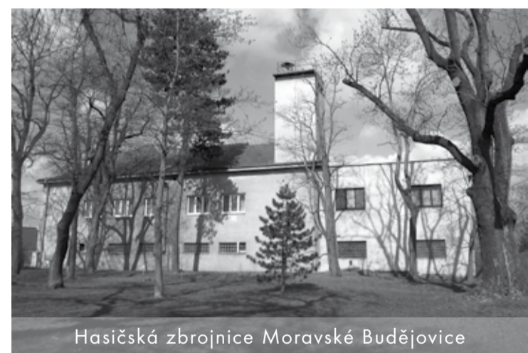
Hasičská zbrojnice Moravské Budějovice