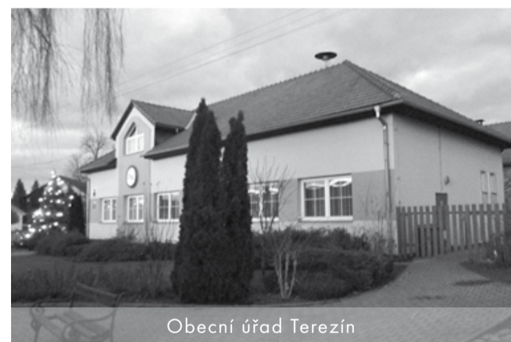
Obecní úřad Terezín