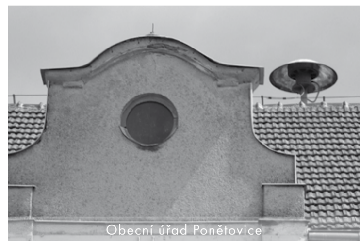
Obecní úřad Ponětovice