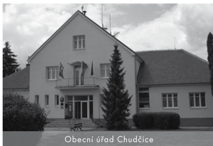
Obecní úřad Chudčice