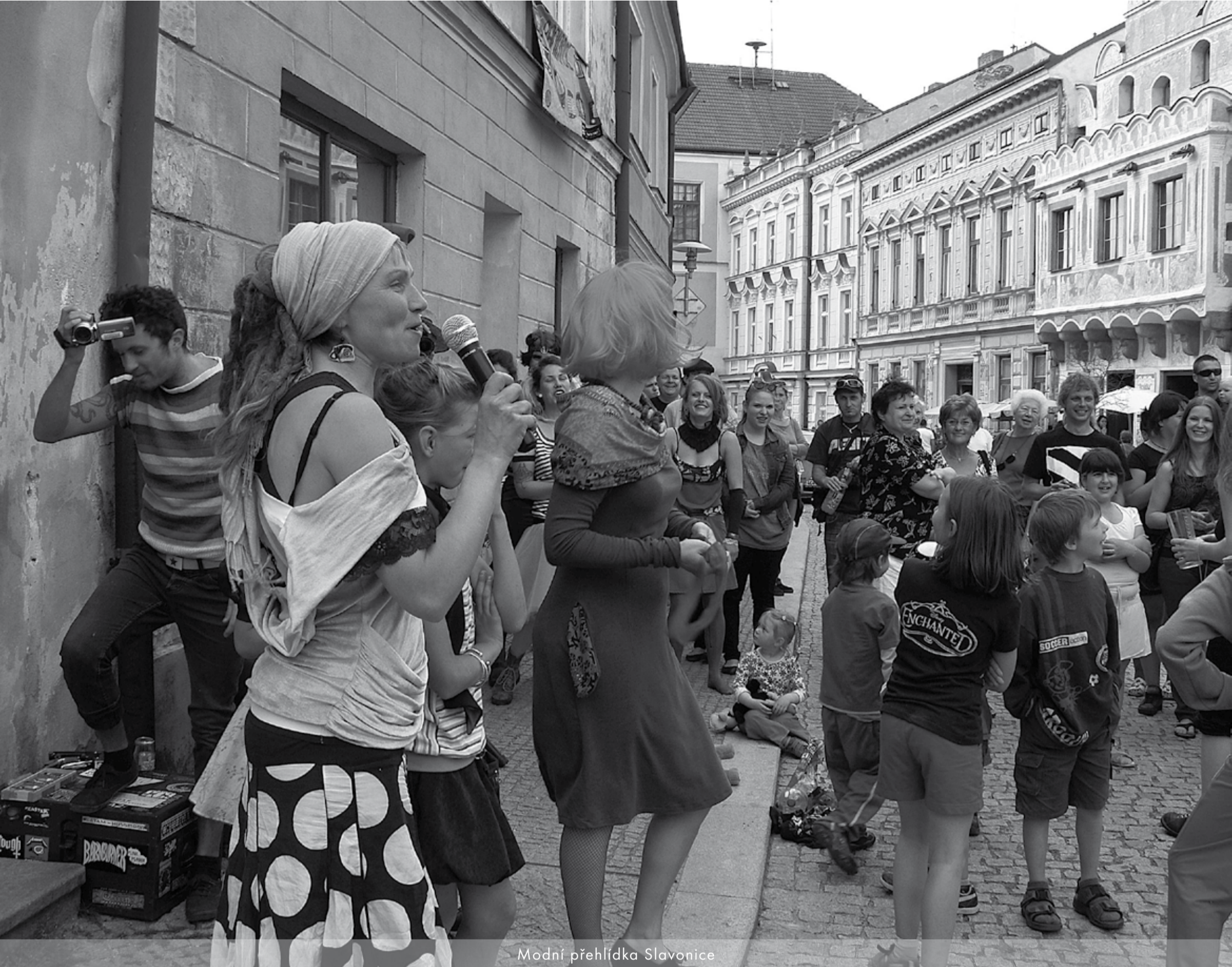
Modní přehlídka Slavonice