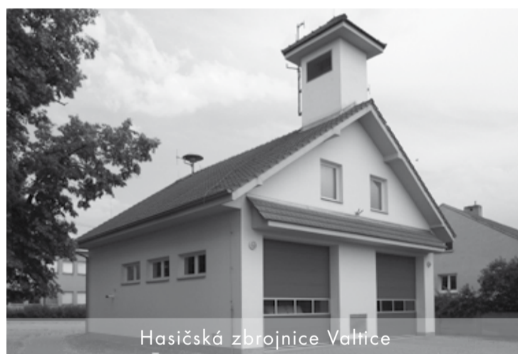
Hasičská zbrojnice Valtice