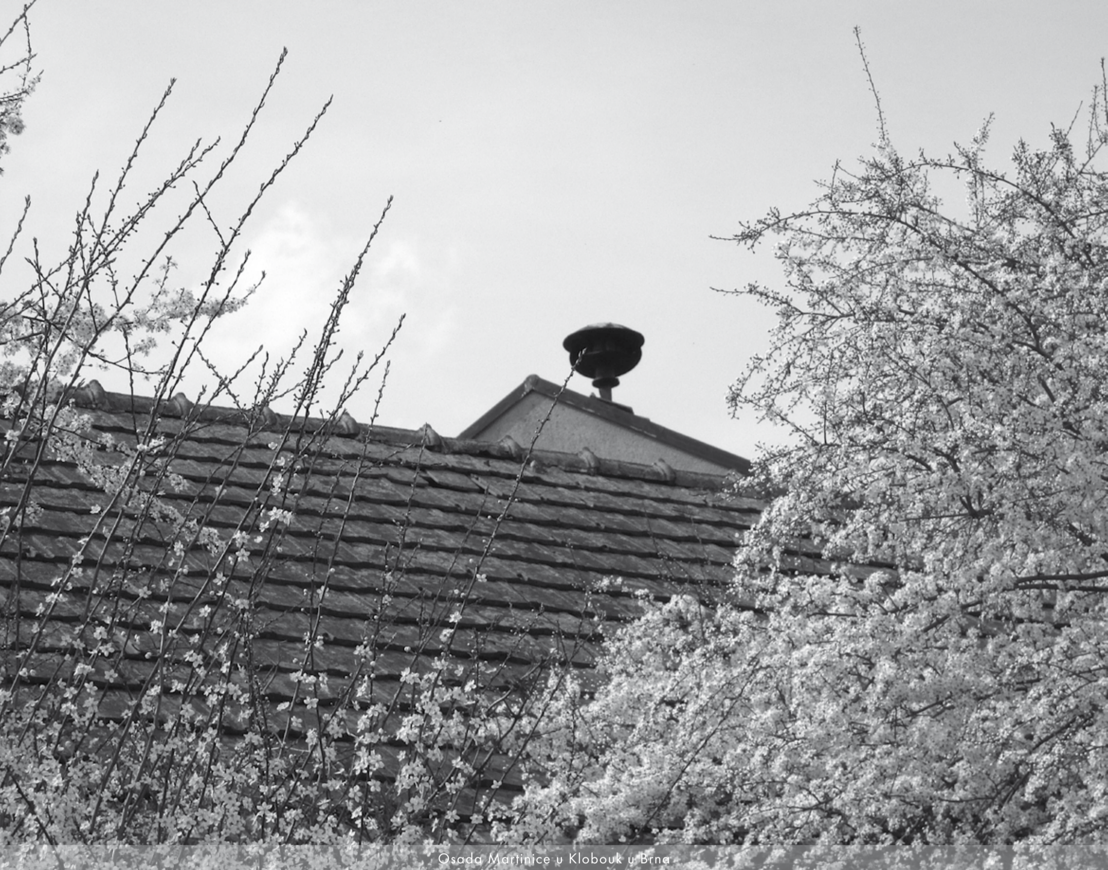
Osada Martinice u Klobouk u Brna