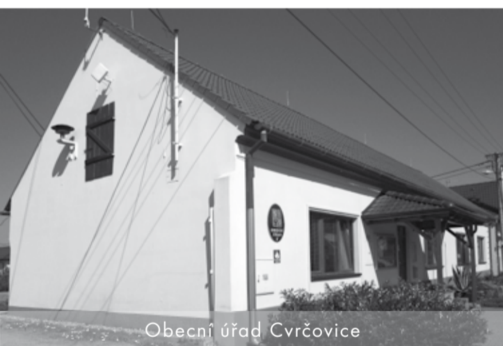
Obecní úřad Cvrčovice