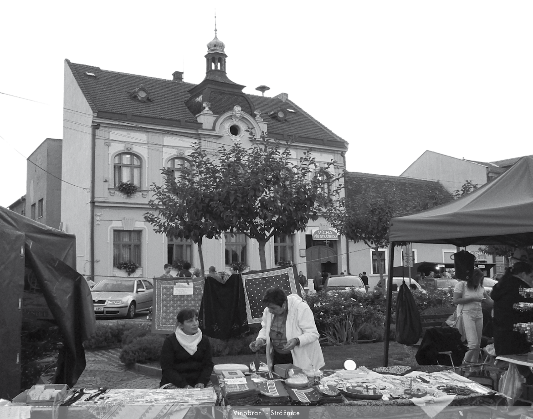
Vinobraní - Strážnice