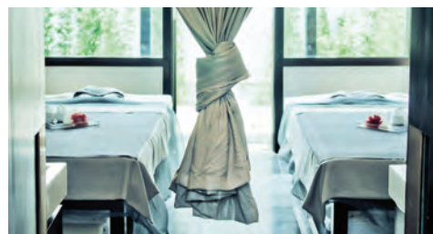
Trị liệu spa trọn gói

Để biết thêm thông tin về Chương trình Trị liệu Fusion hoặc đặt trị liệu, vui lòng liên hệ reservation-dn@fusion-resorts.com