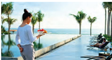
Ăn sáng mọi lúc mọi nơi