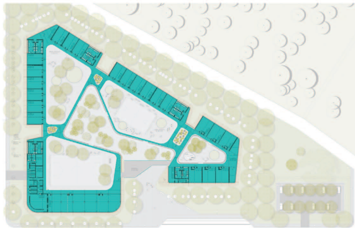
Planta nivel +3.00

En la planta del primer nivel del colegio flor del campo se encuentran ubicadas las aulas de estudio de los grados menores, zonas de servicio como la cafetería, restaurante, bodegaje, patios de recreo dotados de mobiliario (canchas, juegos etc.), los sistemas de circulación del colegio se pasean por cada uno de los patios haciendo del recorrido algo más agradable, en la parte más reducida de la cinta o forma del edificio se sitúa el jardín infantil que debido a su cuidado se aísla de los demás patios para proporcionarle mayor seguridad a los mas pequeños del colegio; otro punto a resaltar es la banca perimetral que bordea todo el colegio la cual tiene como fin hacer que la comunidad entienda el proyecto como un gran mobiliario que pueden usar. En el segundo nivel del colegio se ubican las aulas de los grados superiores, zonas de servicios de baños y laboratorios además de las oficinas de la rectoría y la biblioteca del colegio. La geometría del proyecto responde a la necesidad de