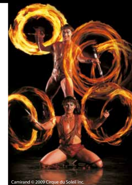
Camirand © 2009 Cirque du Soleil Inc.

Estos y otros universos del mundo artístico de Cirque du Soleil han sido mostrados a través de 21 espectáculos únicos, cada uno de los cuales requiere del trabajo y la entrega de acróbatas, malabaristas, actores, bailarines, expertos en nado sincronizado, gimnastas, músicos y otros artistas y creativos, a quienes se les ofrece “la libertad necesaria para imaginar sus sueños más increíbles y hacerlos realidad”, según explica la compañía.