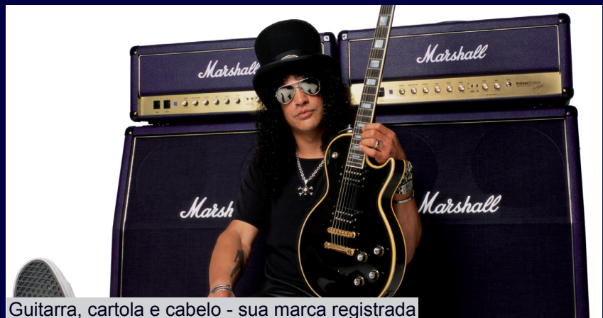
Guitarra, cartola e cabelo - sua marca registrada

Possui entre suas marcas registradas cobrir seu rosto com a longa cabeleira, usar cartola e utilizar muito a escala pentatônica em suas músicas, influência do blues. Seu reconhecimento fica por conta de suas composições que, “teoricamente”, não são tão complexas, mas a sua habilidade faz com que ele adicione um “toque” a mais mesmo em músicas simples. Seus solos também são conhecidos por trazer de volta as influências do blues, na linha do rock dos anos 70, fugindo da tendência de sua época.