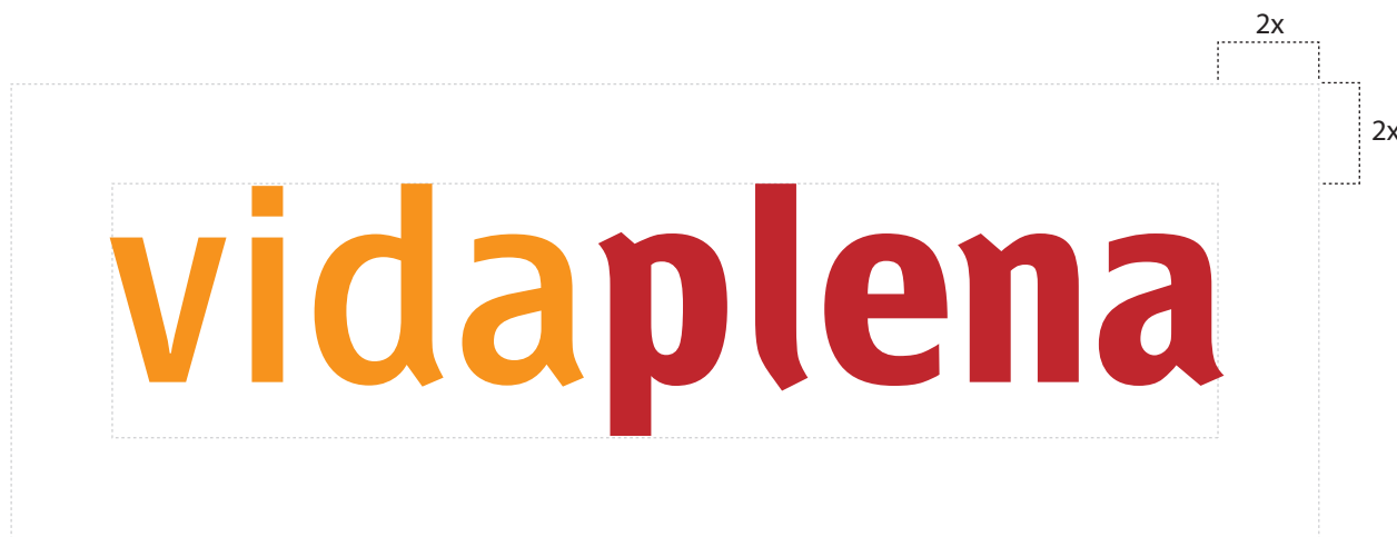
Área de exclusión