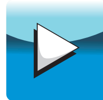
Visualizar fotos tomadas