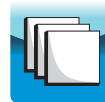
Secuencia de fotos