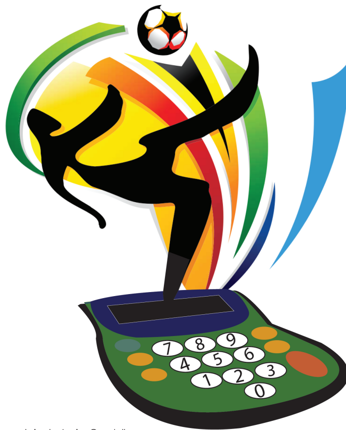
Fotomontaje de Javier Candellero.

"Vivimos la etapa feliz de la inflación"