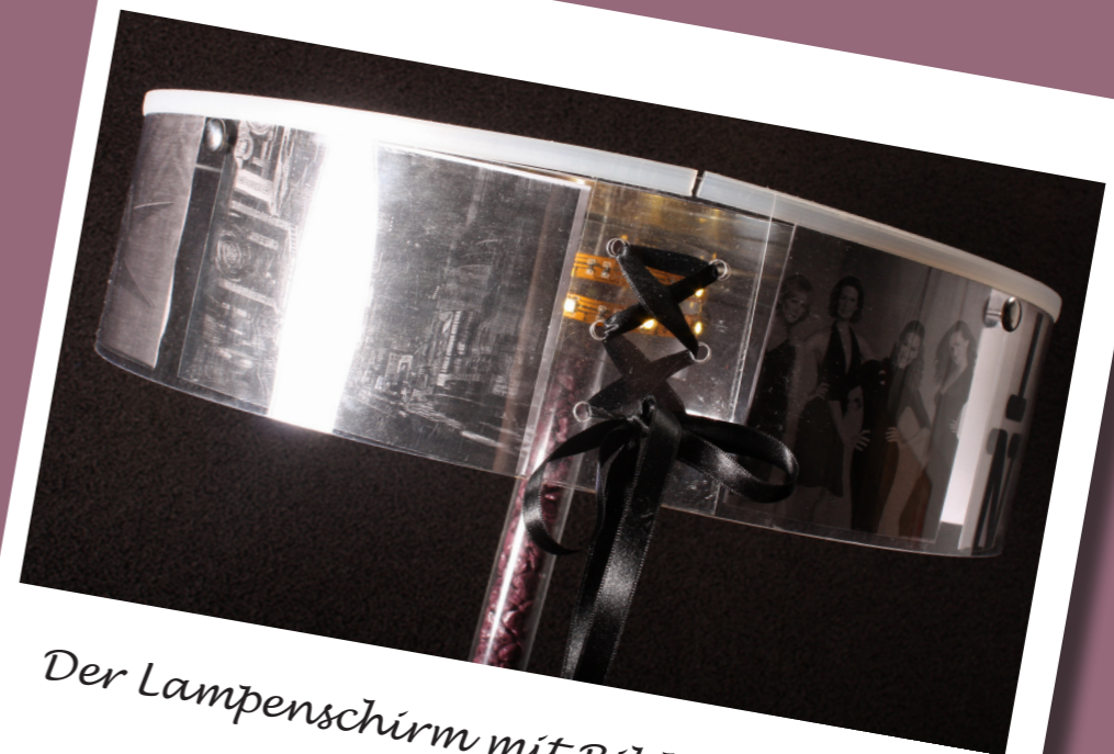
Der Lampenschirm mit Bildern rund um New York