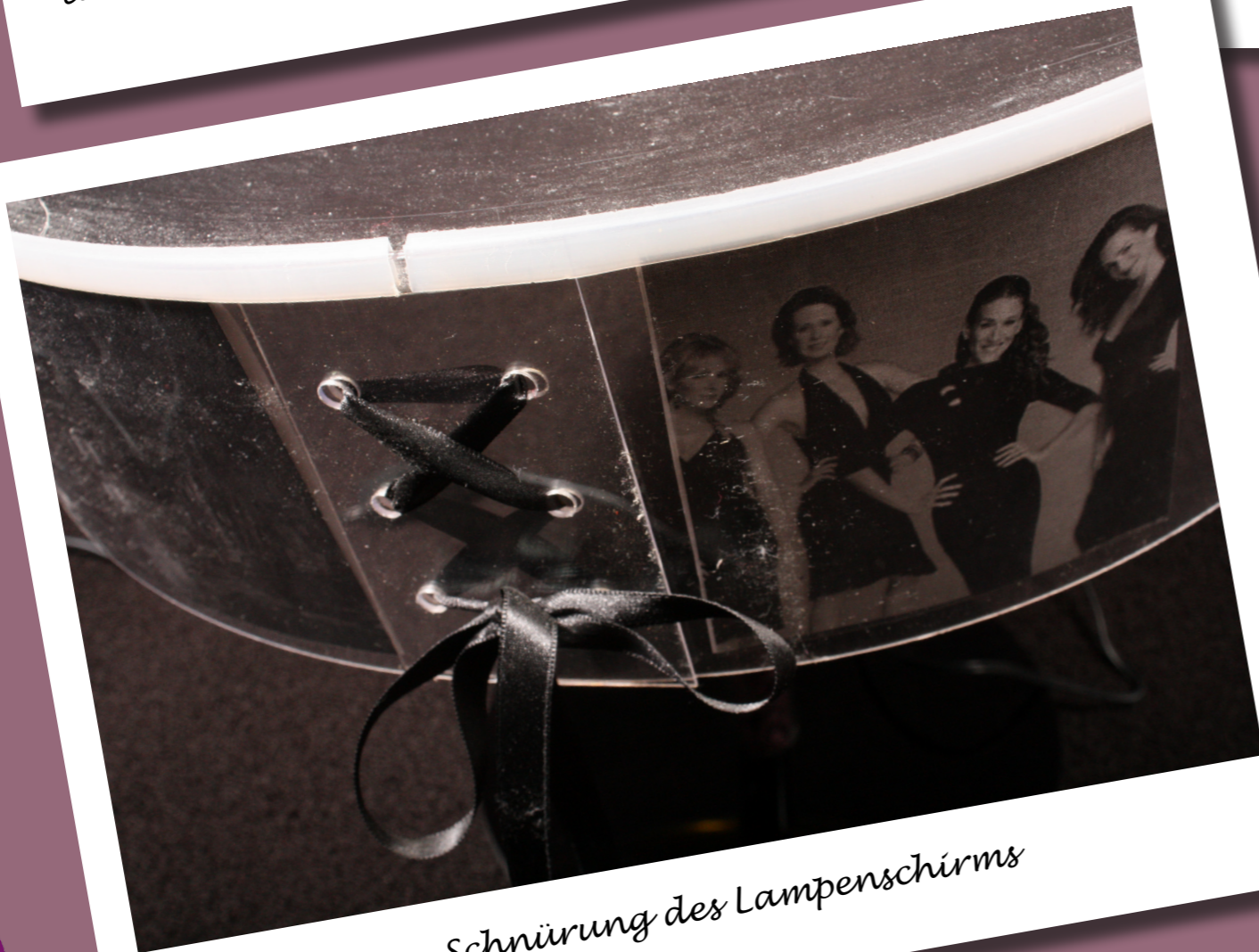
Schnürung des Lampenschirms