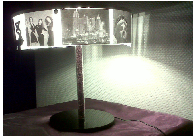
Effekte im Dunkeln

Bei diesem Projekt ging es darum, ein Beleuchtungsobjekt für einen Raum zu entwerfen. Ich habe mich dazu entschieden, in meiner Leuchte das Thema „New York“ aufzugreifen. Der Name „Charlotte“ kommt aus dem Film „Sex and the City“, in dem eine Frau namens Charlotte genauso schlicht, elegant und dennoch außergewöhnlich ist wie diese Leuchte.