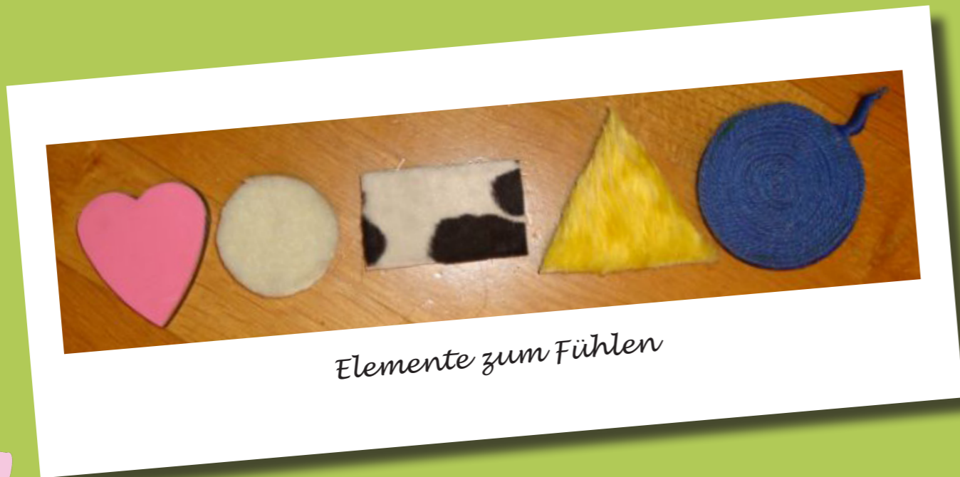
Elemente zum Fühlen