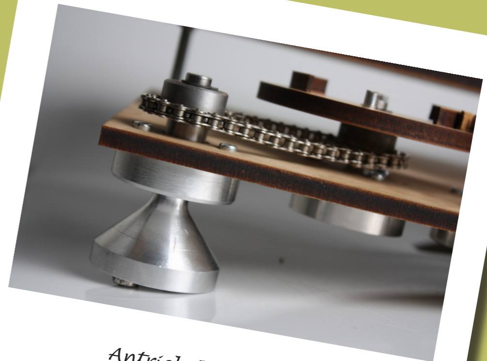
Antrieb der Paneele