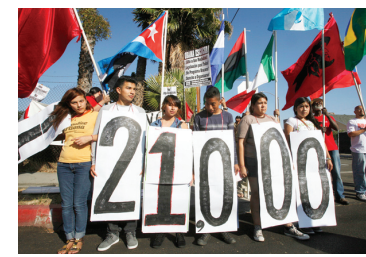
Inmigrantes protestan en Los Ángeles contra políticas de Washington.

Un alto funcionario del gobierno dijo el jueves que las autoridades federales revisarán cada caso de los más de 300.000 inmigrantes ilegales que se encuentran en proceso de deportación. Aquellos que no han cometido crimi-