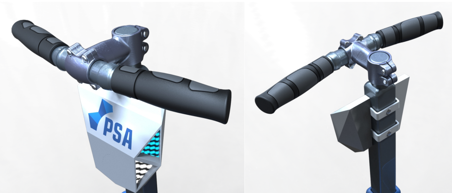
Manillar ergonómico, cómodo al agarre. Caja con luces tipo 'sirena policía'