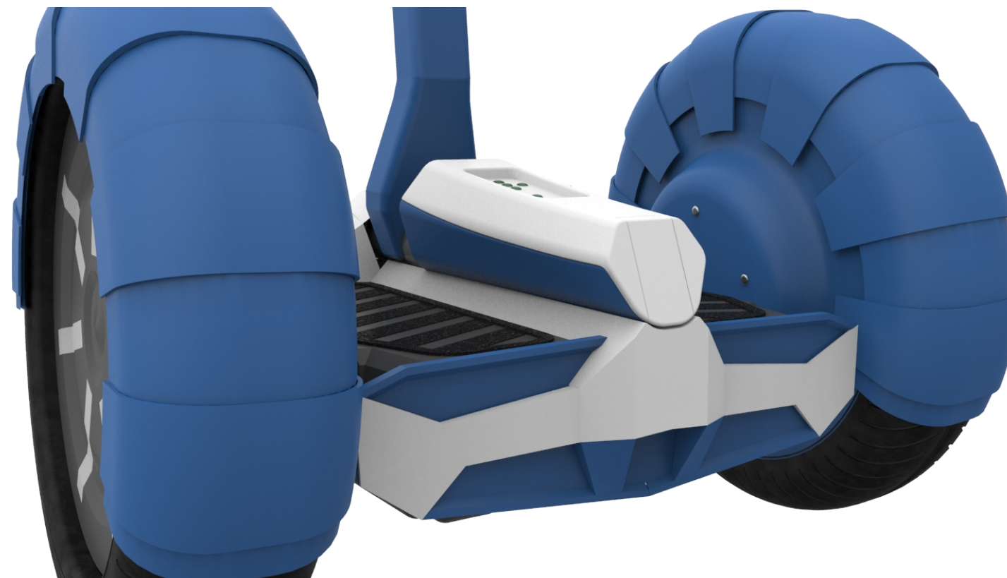
Cola 'agresiva'. Guardabarros robustos que protegen a quien lo utiliza y a los de su alrededor