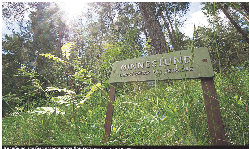
Кладбище, где был развеян прах Даниэля