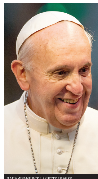
ПАПА ФРАНЦИСК I