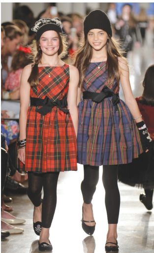
Клетка – одна из основных модных тенденций этого года

Среди школьников постарше популярна так называемая хипстерская мода: узкие галстуки поверх рубашки с завёрнутыми до локтя рукавами у мальчиков, короткие плиссированные юбки с высокими гольфами у девочек. Кроме того, среди старшеклассников очень популярны массивные парки оттенка хаки с пушистым меховым капюшоном, кожаные рюкзаки в ретро-стиле, узкие джинсы и кеды. Переходящая из лета мода на потёртый деним сейчас тоже актуальна – джинсовые куртки и рюкзаки пользуются огромным успехом у учеников средней и старшей школы. METRO