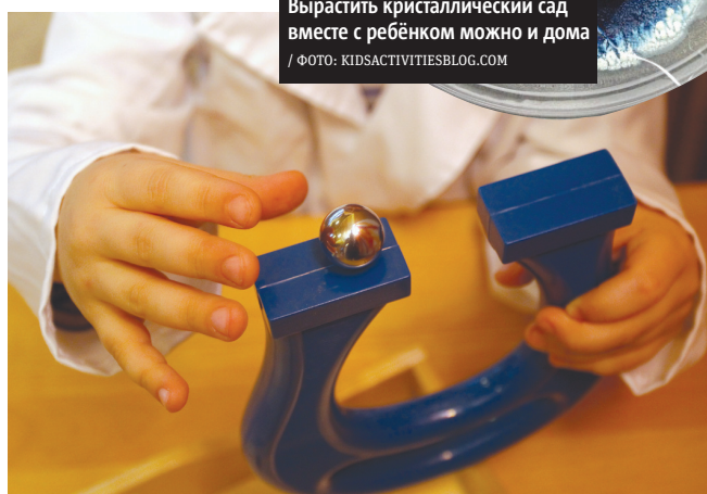
В интерактивном научно-познавательном музее дети сами могут принять участие в химических и физических опытах