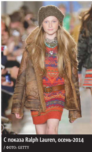
С показа Ralph Lauren, осень-2014

рублей – столько готовы платить за школьную форму большинство россиян по версии опроса, проведённого ОНФ (Общероссийский народный фронт)