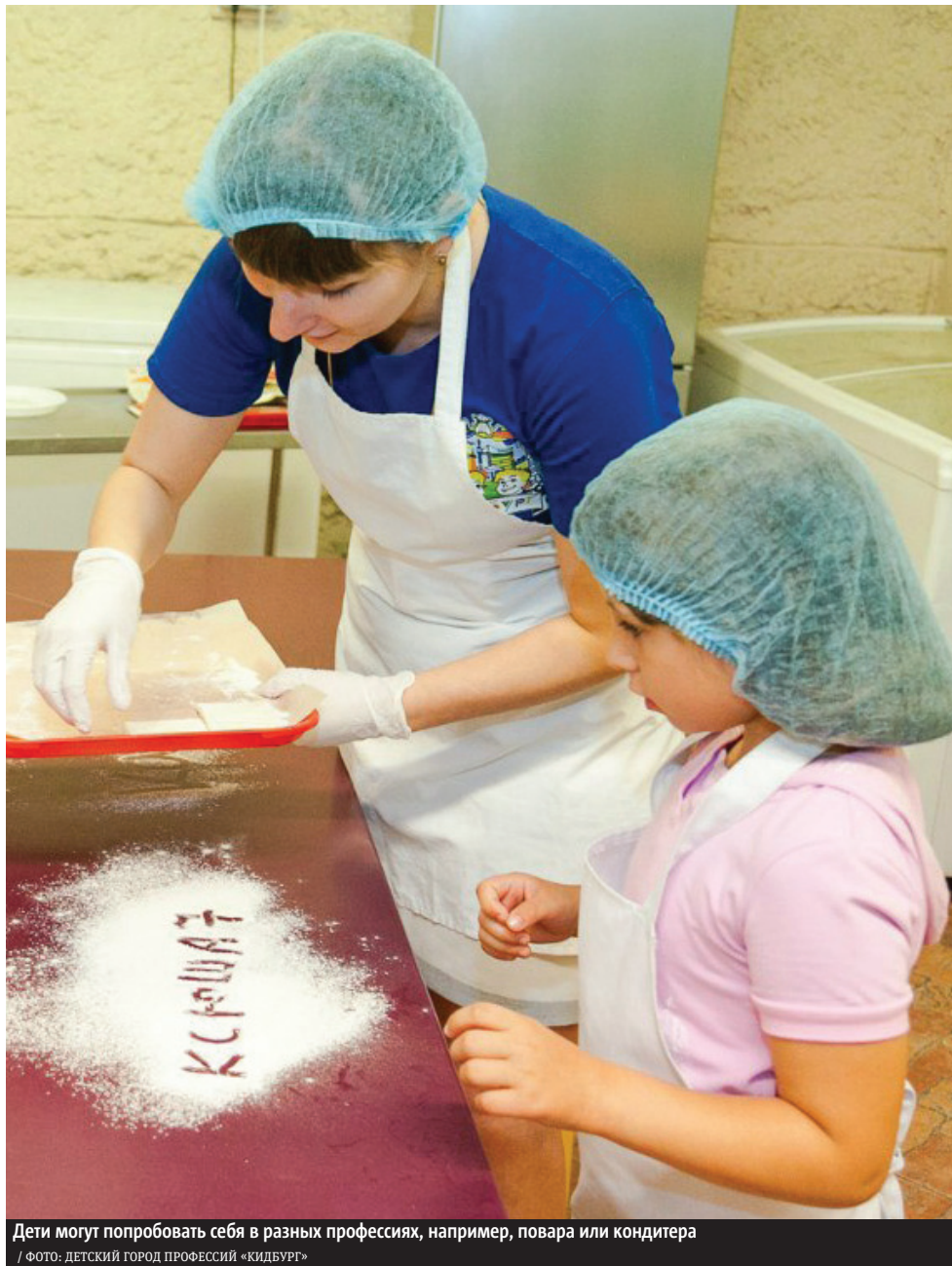
Дети могут попробовать себя в разных профессиях, например, повара или кондитера