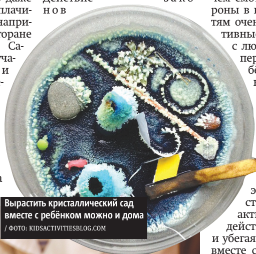
Вырастить кристаллический сад вместе с ребёнком можно и дома

ростков 14–17 лет есть даже возможность пройти оплачиваемую стажировку – например, на заводе, в ресторане или редакции газеты. Самые маленькие могут участвовать в групповых и индивидуальных интерактивных играх, связанных с поиском себя в мире разнообразных специальностей, а также попробовать себя в различных профессиях – например, журналиста, мастера маникюра или ведущего на радио.