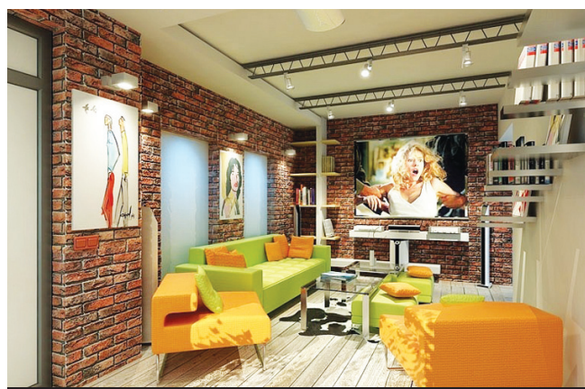
Лаконичная яркая мебель особенно выигрышно смотрится на фоне грубых кирпичных стен