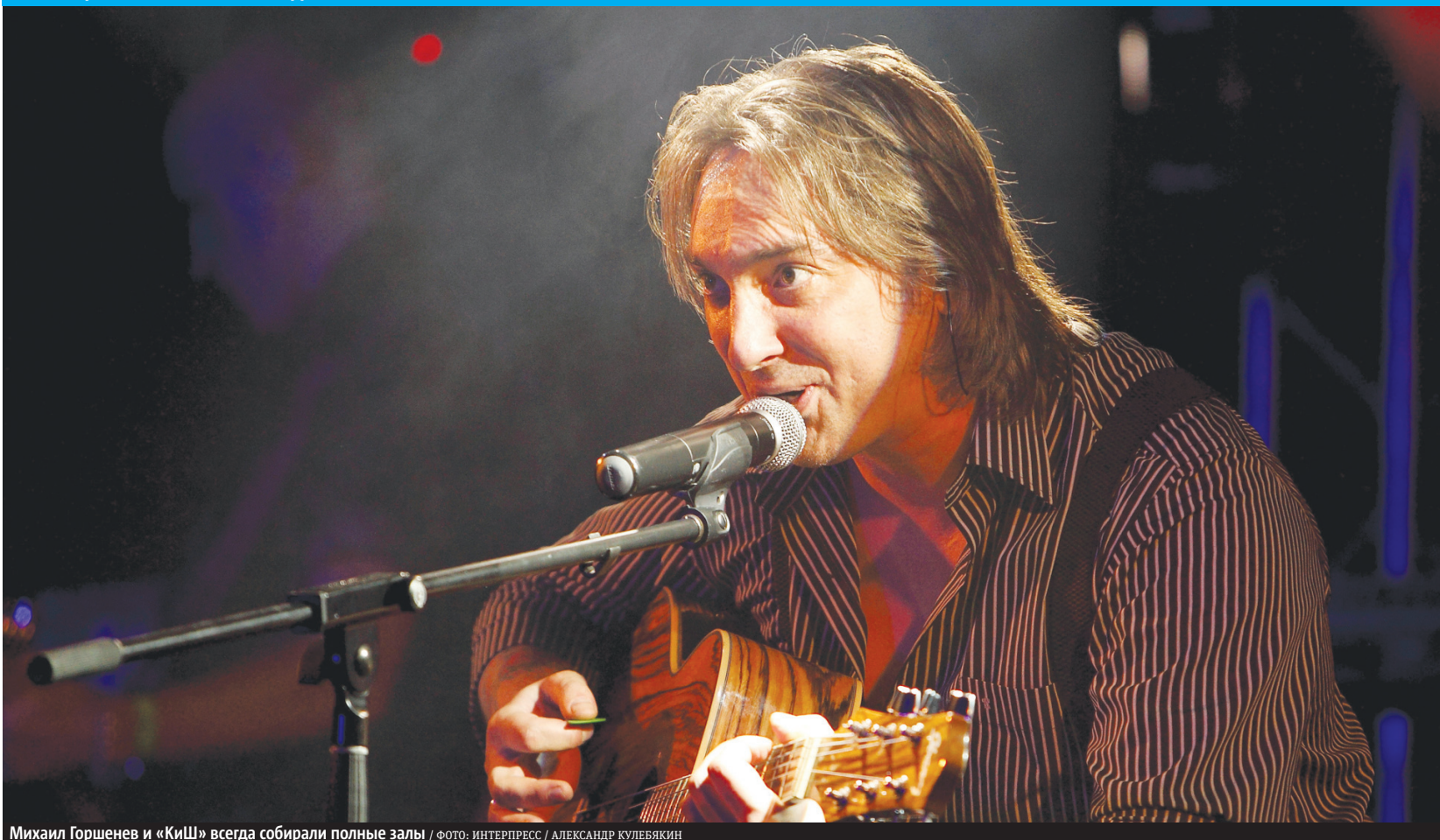
Михаил Горшенев и «КиШ» всегда собирали полные залы