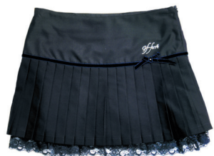
Блуза, жилет, юбка - GF Ferre балетки Eli