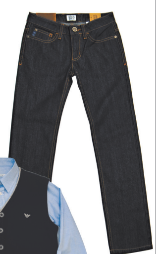
Жилет, джинсы - Armani рубашка GF Ferre