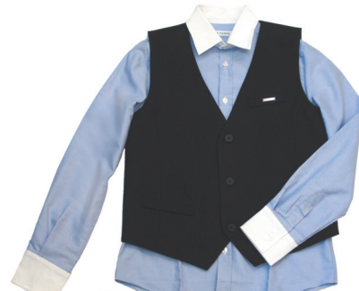
Жилет, брюки - Armani рубашка GF Ferre