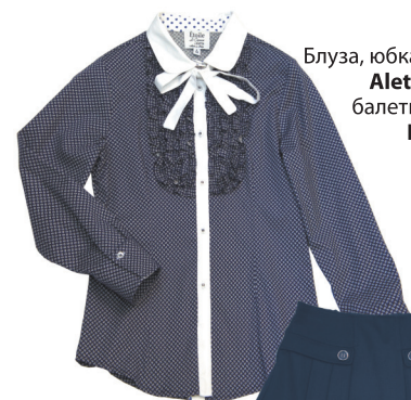
Блуза, юбка - Aletta балетки Eli