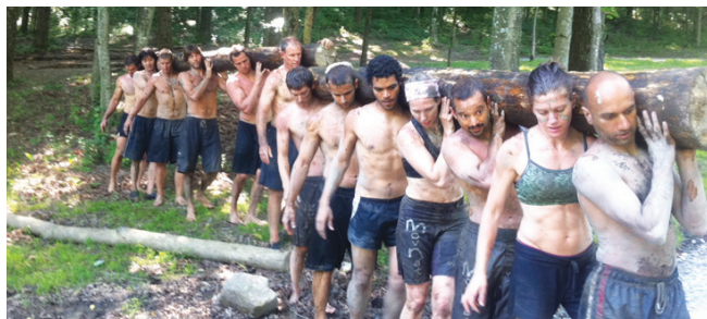
Участники MovNat-движения имитируют естественную жизнь наших предков

жизнью Маугли, но только в городских джунглях: он практически постоянно пребывал на улице, имитируя поведение своих дальних суровых сородичей: плавал в холодной воде, прыгал с дерева на дерево, лазал по мостам. Свою систему MovNat француз вынашивал и развивал долгие годы, испытывая её сначала на себе, а затем на своих единомышленниках-волонтерах, не имеющих спортивного опыта. Они вместе жили и тренировались. МЕТРО