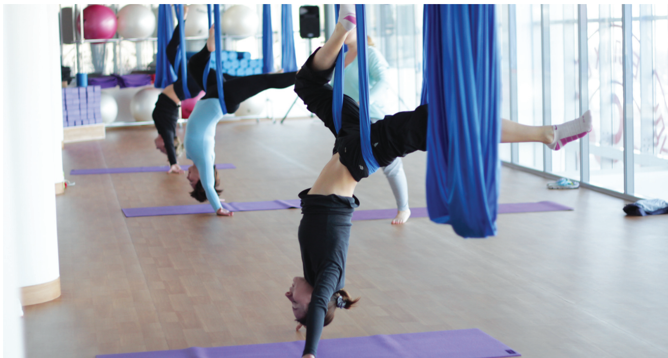
В гамаке многие сложные асаны из йоги выполняются легко

принципиально нет зеркал, чтобы люди не отвлеклись на самих себя. Когда человек смотрит в зеркало, есть момент сопоставления себя с тренером. А так они не могут себя оценить и поэтому двигаются свободно, нет напряжения и желания сразу сделать красиво и правильно. Мы не мешаем людям учиться двигаться, нет никаких внешних вмешательств, человек двигается так, как он сам понимает. Конечно, это пока экзотическое для России направление. У нас менталитет немного другой: русские хотят результат сразу, а поэтому предпочитают функциональный тренинг. То есть если ты не выполнил из зала изможденным, значит, зря сходил. А за границей тренируются по-другому. Они получают удовольствие от процесса и понимают, что не только из-