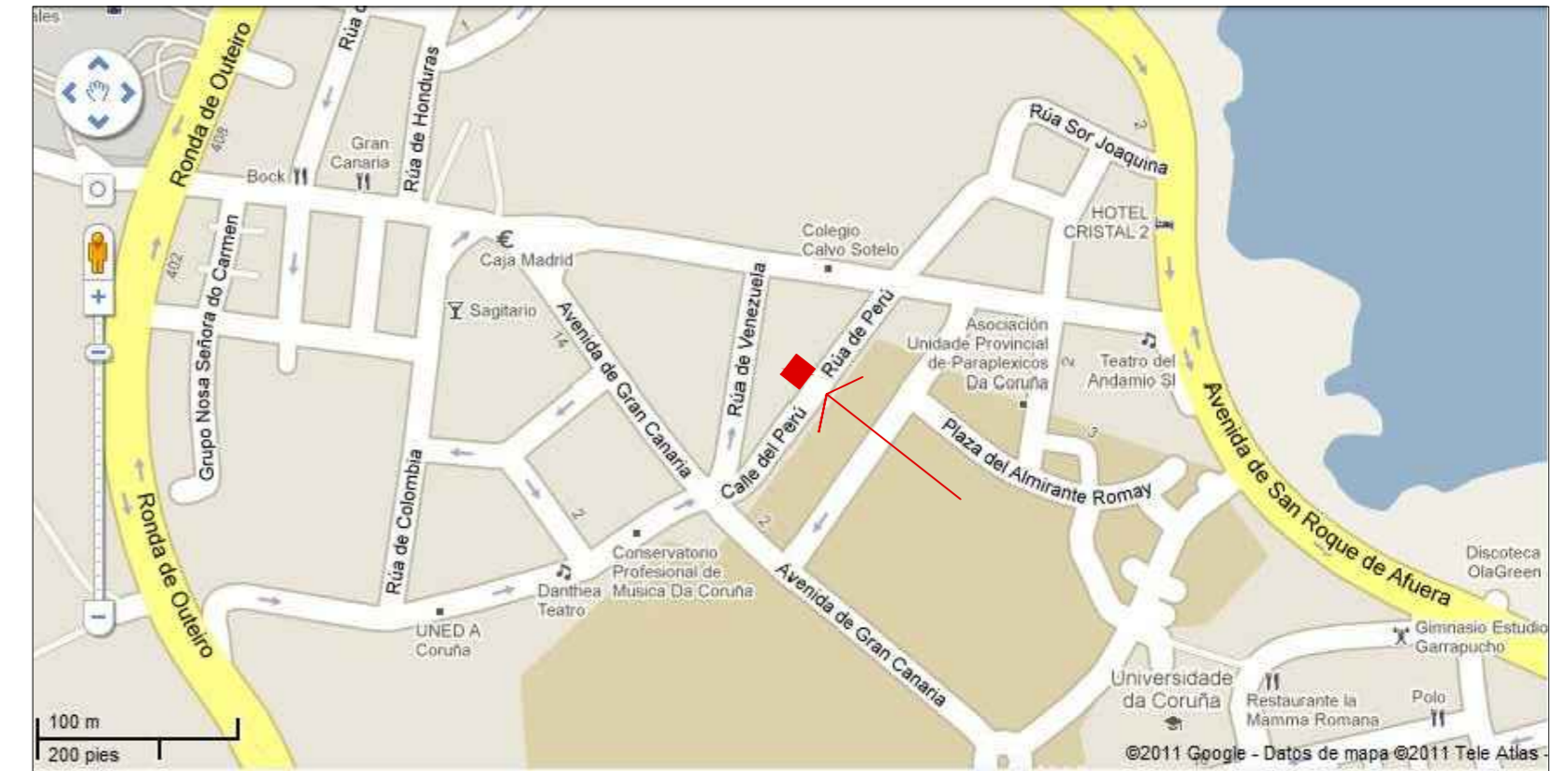
SITUACIÓN. CIUDAD DE A CORUÑA.