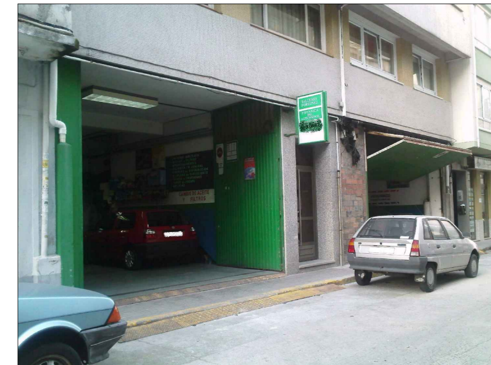
ESTADO ACTUAL LOCAL.