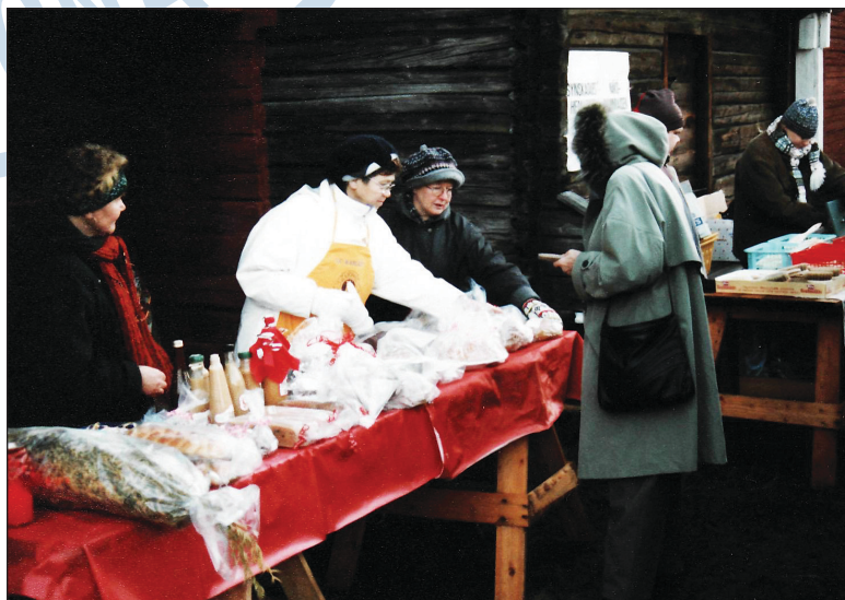
Bild från julmarknaden vid hembygdsgården.

Aktiviteter av mer social natur tillsammans med bröderna har det funnits gott om under åren. Vi har varit på gemensamma teaterresor till Wasa Teater, gjort industri-, företags- och anstaltsbesök (t ex det nya polishuset och biblioteket i Karleby), hört på föredrag av inspirerande personer och presentationer av intressanta ämnen, varit på vandringsturer och haft andra motionstillfällen tillsammans, avnjutit en gemensam matbit efter avslutat månadsmöte samt naturligtvis haft våra årligen återkommande jul- och vårfe스터 tillsammans.