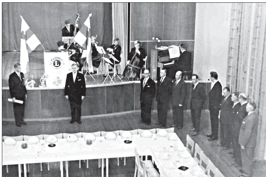
Charter Night, hölls den 21 oktober 1961 i Villa skola.

Själva invigningsfesten, klubbens Charter Night, hölls den 21 oktober 1961 i Villa skola. Programmet upptog musik av Erik och Anna-Lisa Fordell, Villa skolorkester uppträdde, invigningstalet hölls av guvernören Viljo Tervaranta som överlämnade charterbrevet till den nybildade klubben.