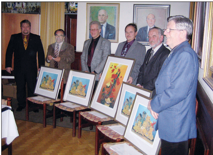
Aktivt deltagande i Röda Fjäders kampanjen resulterade i tavlor och tacksamma ord.

mästerskapstävlingar. Klubben hade stora framgångar. Klubben ordnade även klubbmästerskapet i pidro och bowling.