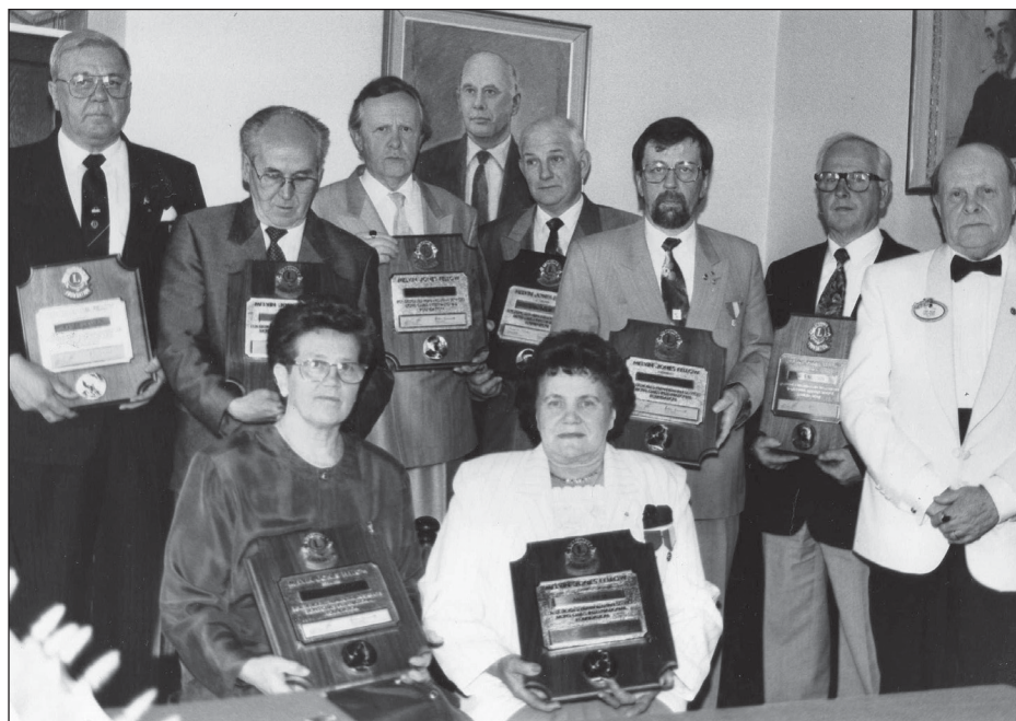
Utdelning av Melwin Jones-utmärkelsen till aktiva lionsmedlemmar och ladies.

Under perioden 1981-1991 utdelade klubben sammanlagt 253 644 mark i stipendier och understöd.