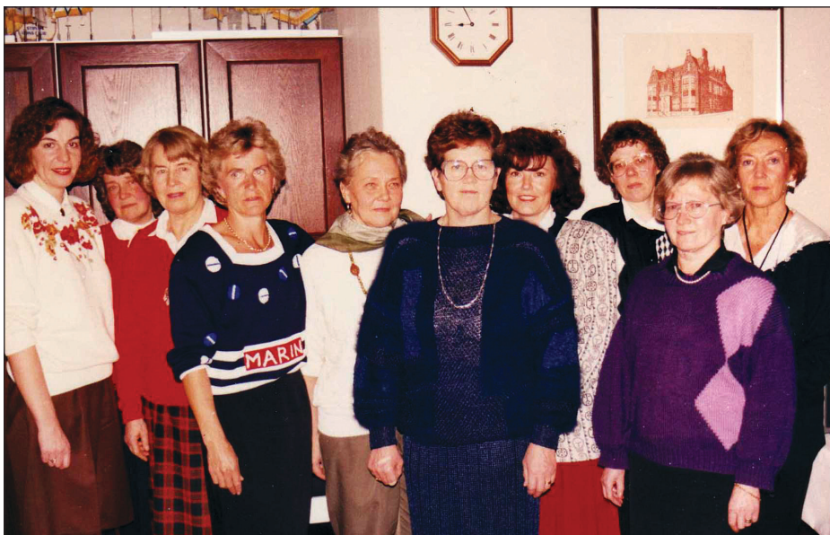
En del av LC Karlebys ladies samlade i november 1991.