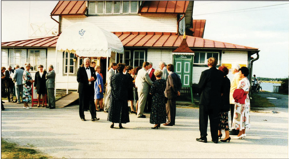
Den 25 augusti 2001 firade klubben sitt 40-årsjubileum på Mustakari.