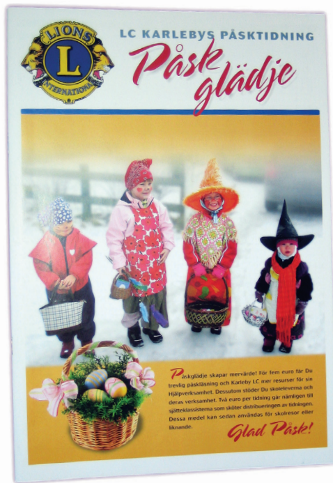
Påsktidningen som klubben gav ut 2009 fick ett positivt mottagande.