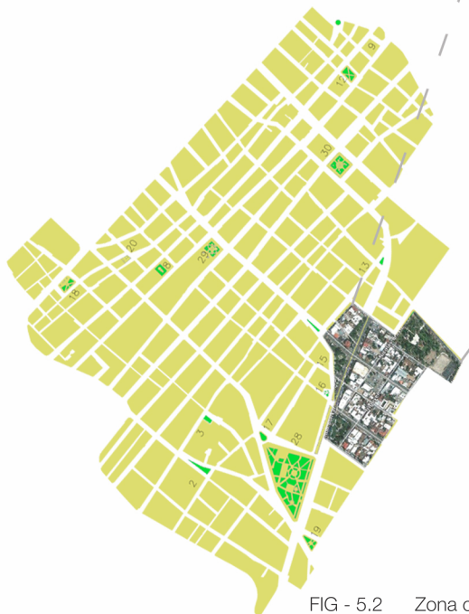
FIG - 5.2 Zona centro Plan de desarrollo urbano 2040