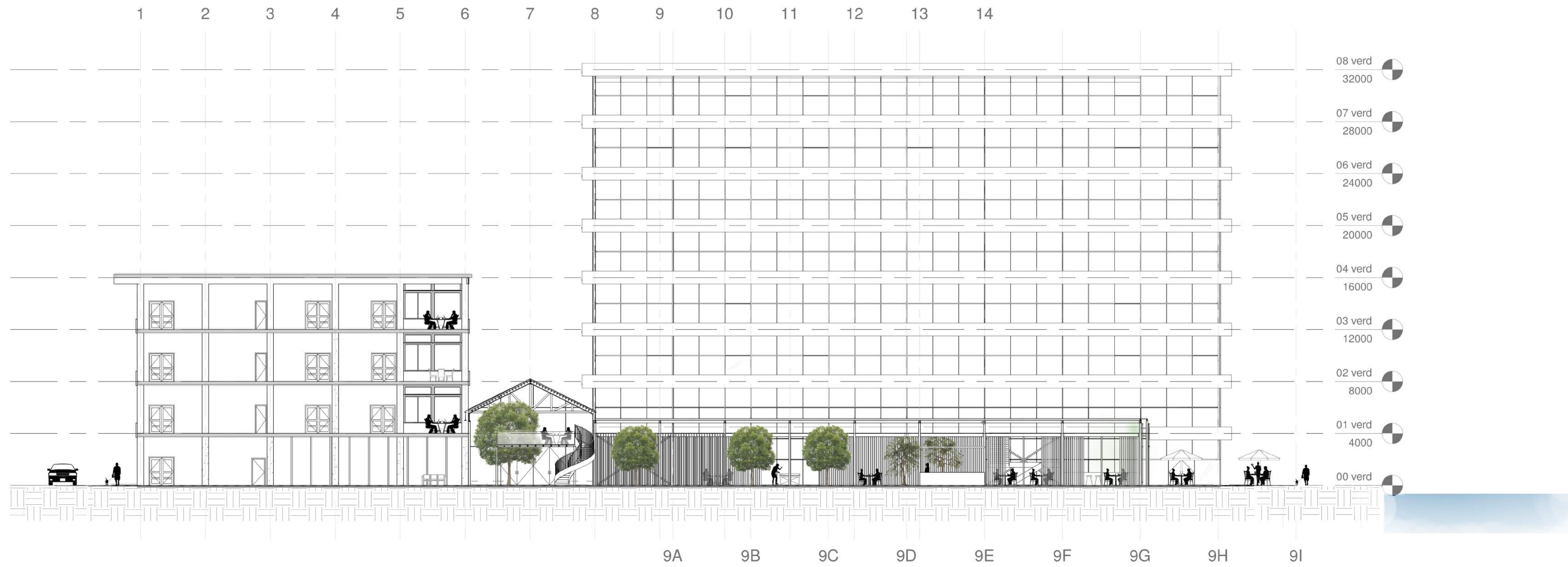
1 Doorsnede AA 1 : 200