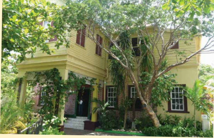
Rumah Bob Marley

Tiket masuknya cukup mahal, seharga US$20/orang dan saya diberi karcis kecil berwarna hijau bertuliskan WAKE UP AND LIVE, salah satu judul lagu Bob. Kita tidak bisa masuk sendiri untuk melihat-lihat, tetapi harus menunggu group tour yang diadakan setiap jam. Sambil menunggu, saya berfoto di depan patung Bob yang sedang memegang gitar. Yay! Di halaman depannya yang rindang pun terdapat foto-foto Bob dan keluarganya yang dicat pada pagar. Saya baru tahu wajah istri sahnya, Rita Anderson, itu uelek tenan , nggak sebanding dengan Bob yang ganteng itu. Ya, saya memang sirik.