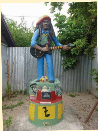
Datung Bob Marley di French Town Jamaica