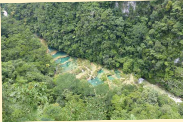
Semuc Champey

Dikelilingi hutan hijau yang lebat, ada sungai berair warna turkuois yang lanskapnya bertingkat-tingkat dan masing-masing membentuk kolam alami! Setiap trap kolamnya membentuk pematang yang ditumbuhi pepohonan rimbun dan di selanya turunlah air terjun jernih. Sungguh spektakuler!