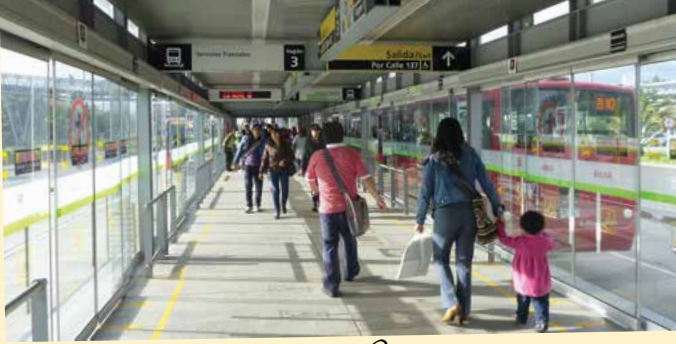
Halte busway Bogota