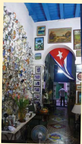
Paladar di Havana