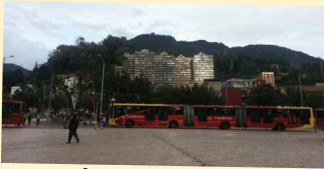
Busway di Bogota

Informasi rute bus jelas terpampang beserta warna-warni khusus seperti warna jalur MRT. Bahkan, ada informasi digital yang menyatakan bahwa bus A datang dalam sekian menit! Lalu, kita mengantre di depan pintu kaca sliding yang otomatis terbuka kalau bus berhenti. Setiap pintu bus terbuka, tidak hanya daun pintunya, tapi juga keluar pijakan sehingga tidak ada gap antara bus dan platform stasiun.