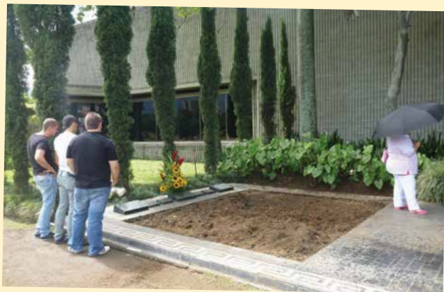
Makam Pablo Escobar

Perang antara Kartel Medellin dan Kartel Cali membuat Medellin hancur dan mengerikan sehingga menjadikannya kota dengan tingkat pembunuhan tertinggi di dunia. Ribuan orang dikabarkan tewas. Pemerintah Kolombia pun sulit membendung aksi mereka. Konon 85% kantor polisi saja dibom dan ratusan polisi tewas! Sebenarnya, Escobar pernah berkali-kali masuk penjara, tapi selalu lolos karena bisa disogok. Prinsip Escobar saat berurusan dengan pemerintah adalah plata o plomo , harfiahnya 'perak atau pispin', maksudnya "pilih terima sogokan atau pilih ditembak". Widih! Walaupun begitu, Escobar yang saat itu