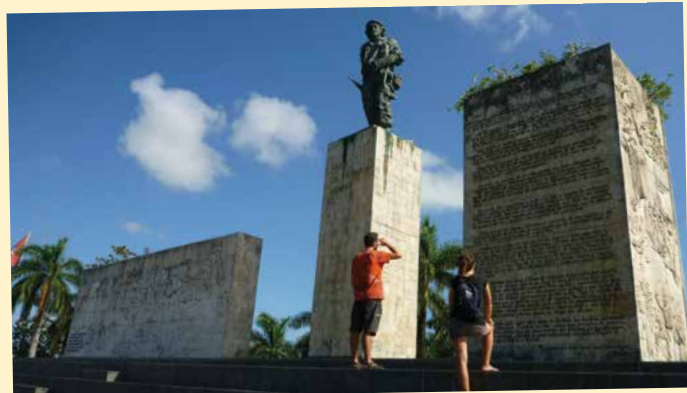
Monumen Che di Santa Clara