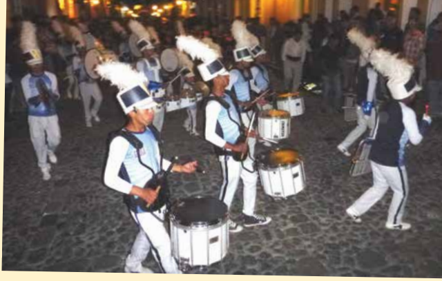
Marching band di Antigua

ngejreng , dan bendera warna-warni. Cewek-cewek yang jadi color guards pun berjoget semangat.