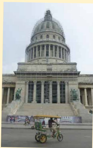
Capitolio - Havana

si Kuba sejak 1950. Revolusi yang dipimpin oleh trio Fidel Castro, Che Guevara, dan Camilo Cienfuegos ini untuk menjatuhkan tirani Presiden Fulgencio Batista yang dianggap koruptor dan membiarkan AS mendominasi perekonomian Kuba. Di bagian belakang museum terdapat Granma, kapal yacht yang mengangkut 82 orang pejuang berlayar dari Meksiko ke Kuba untuk menumbangkan Batista. Hanya segelintir yang selamat, termasuk trio itu dan adik Fidel Castro bernama Raul yang sekarang menjadi presiden. Dengan kemenangan ini maka Castro dan kawan-kawan pun membentuk negara sosialis dan partai komunis sehingga hubungannya dengan AS terputus.