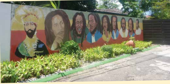
Bob dan anak-anaknya

Tour leader bilang, “Tahu nggak lagu Bob Marley yang dinobatkan sebagai Song of the Millenium dunia dan dijadikan lagu bertema perdamaian?”