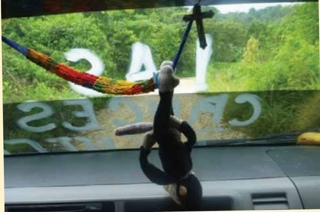
Di dalam travel

Saya lapar luar biasa karena tidak sempat sarapan dan makan siang. Makin lapar melihat si sopir santai makan ayam goreng dan tortilla sambil nyetir sampai setirnya berminyak, sementara mobil tidak pernah berhenti istirahat. Bekal saya berupa pisang, keripik, dan air putih sudah habis, tapi belum sampai juga. Sudah lima jam perjalanan, kok, pemandangan sekelilingnya seperti tidak ada tanda-tanda kehidupan? Isinya kebun jagung, semak-semak, rerumputan. Gimana mau pipis coba? Kok, tidak ada seorang pun penumpang yang minta mobil berhenti? Nggak ada yang kebetul apa? Tak tahan lagi, akhirnya saya yang bilang ke sopir dan ia baru berhenti di sebuah pom bensin sepi. Seluruh penumpang turun dengan tubuh gontai. "Sepuluh menit lagi kembali, ya!" kata kenek. Doh, kita ini penumpang bus atau tawanan Nazi, sih!?