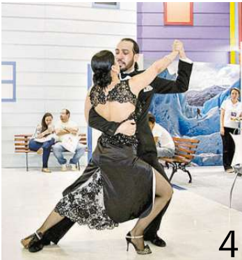
■ Show de Tango Faistango, trazido pela Argentina (foto 4)