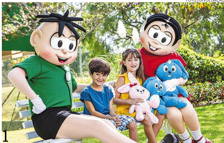
■ Turma da Mônica (recepção no estande, mais foto), trazida pelo Grupo Bourbon (Bourbon Atibaia Convention & Spa Resort e o Bourbon Cataratas Convention & Spa Resort) (foto 1)