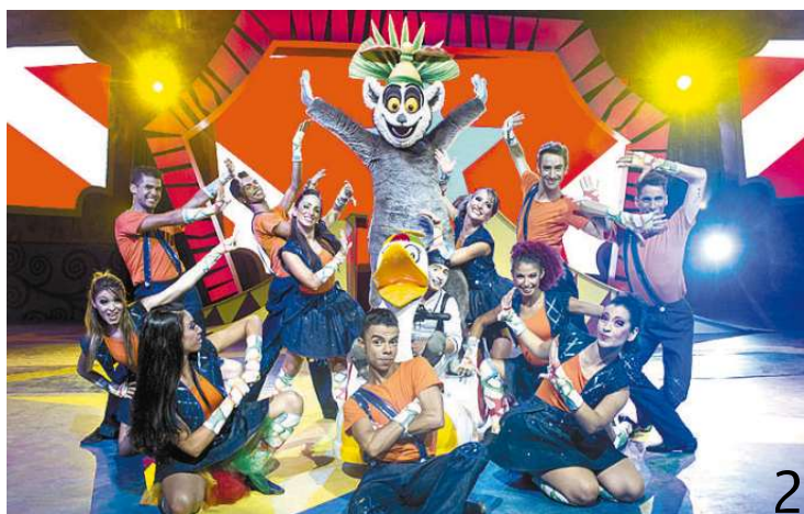
■ Madagascar (apresentação, mais fotos), do Grupo Beto Carrero (foto 2)