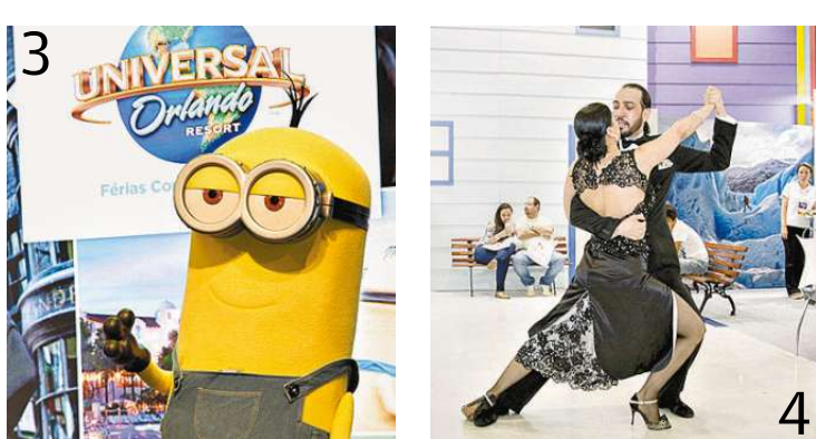
■ Gru e os Minions (fotos), com a Universal Orlando (foto 3)