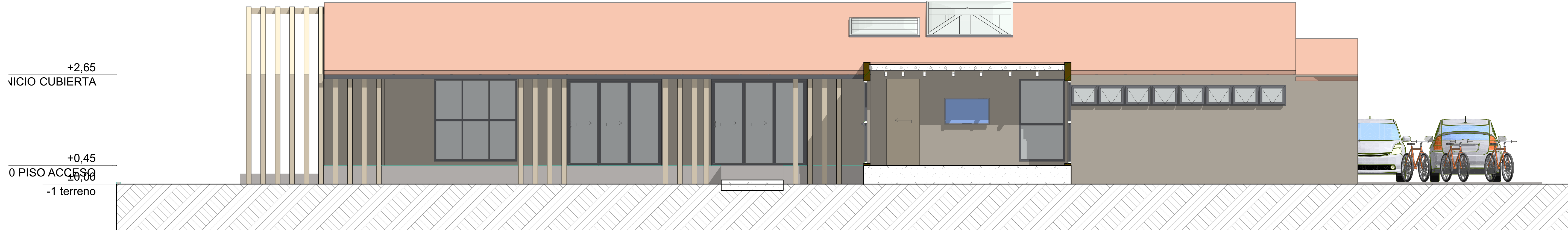
E-06 Alzado Norte 1:50