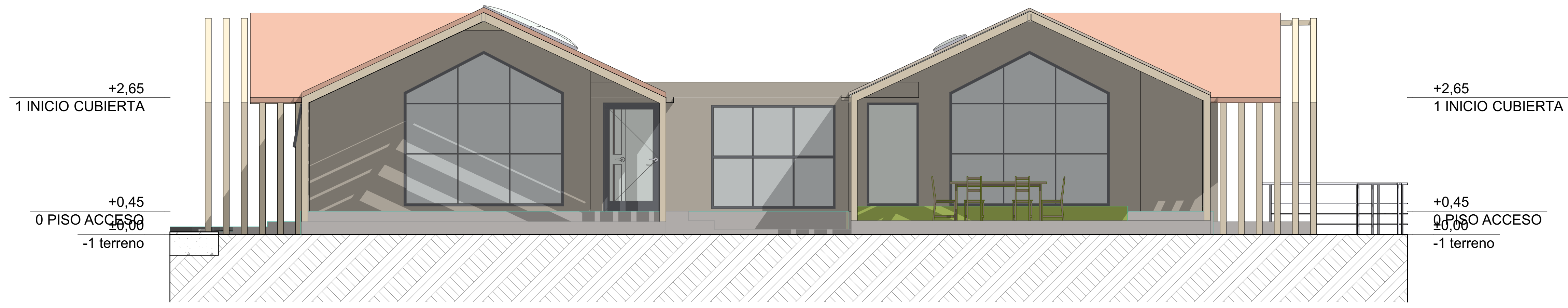
E-02 Alzado Oriental (1) 1:50